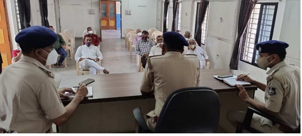
મેગીના થાય તે માટે નર્મદા પોલીસ ખાસ નજર રાખશે.

પ્રતિબંધક અધિકારીને જાણ કરવા અનુરોધ અક્ષય તૃતીયાના દિવસે રાજપીપળા સહિત નર્મદા જિલ્લામા નર્મદા પોલીસની લગ્ન પ્રસંગોમાં બાજ નજર રહેશે