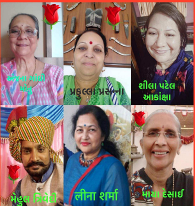
ન્યૂઝ ઓફ ગાંધીનગર દૈનિક આયોજિત સાહિત્ય સરિતા આઠ પદ્ય રચના પ્રસિદ્ધ કરવામાં આવી છે.