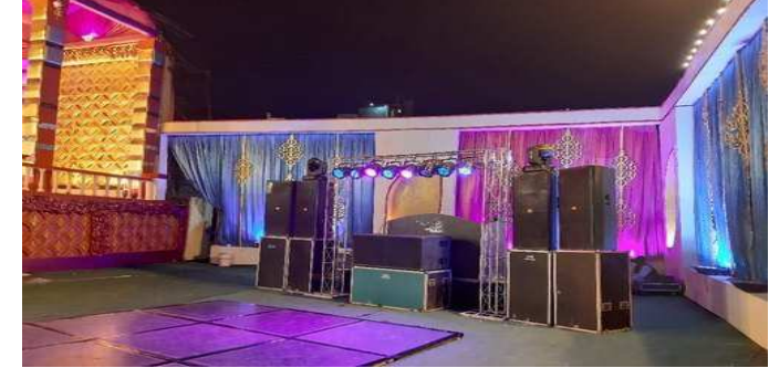
રાજપીપલા, તા ૬ રાજપીપલા સહીત નર્મદા જિલ્લા મા કોરોનાના કેસો વધી રહ્યા છે. મોત નો આંકડો પણ વધી રહ્યો છે. બીજી તરફ નર્મદા જિલ્લા મા લગ્ન પ્રસંગો પૂર બહાર મા ખીલી ઉઠ્યા છે સરકાર ની કોવિડની ગાઈડલાઈન મુજબ લગ્ન પ્રસંગ મા ૫૦થી વધુ લોકો ને ભેગા કરવા પર પ્રતિબંધ છે છતાં લોકો ૫૦થી વધુ ૮૦થી ૧૦૦કે તેથી વધુ લોકોને ભેગા કરી કોરોનાને વકરાવી રહ્યા હોઈ આવા લોકો સામે પોલીસે જાહેરનામા ભંગનો ગુનો દાખલ કરી કાયદેસરની કાર્યવાહી હાથ ધરી છે.

ત્યારે બીજી બાજુ લોકો લગ્ન પ્રસંગ નાચગાન કરવાનું વિસરતાં નથી તેથી ડીજે, સ્પીકર જેવા વાજિત્રો મન્ગાવી જાહેર મા વરઘોડો કાઢી નાચગાન કરતા રાજપીપલા, તા ૬ રાજપીપલા સહીત નર્મદા જિલ્લા મા કોરોનાના કેસો વધી રહ્યા છે. મોત નો આંકડો પણ વધી રહ્યો છે. બીજી તરફ નર્મદા જિલ્લા મા લગ્ન પ્રસંગો પૂર બહાર મા ખીલી ઉઠ્યા છે સરકાર ની કોવિડની ગાઈડલાઈન મુજબ લગ્ન પ્રસંગ મા ૫૦થી વધુ લોકો ને ભેગા કરવા પર પ્રતિબંધ છે છતાં લોકો ૫૦થી વધુ ૮૦થી ૧૦૦કે તેથી વધુ લોકોને ભેગા કરી કોરોનાને વકરાવી રહ્યા હોઈ આવા લોકો સામે પોલીસે જાહેરનામા ભંગનો ગુનો દાખલ કરી કાયદેસરની કાર્યવાહી હાથ ધરી છે. ત્યારે બીજી બાજુ લોકો લગ્ન પ્રસંગ નાચગાન કરવાનું વિસરતાં નથી તેથી ડીજે, સ્પીકર જેવા વાજિત્રો મન્ગાવી જાહેર મા વરઘોડો કાઢી નાચગાન કરતા રાજપીપલા, તા ૬ રાજપીપલા સહીત નર્મદા જિલ્લા મા કોરોનાના કેસો વધી રહ્યા છે. મોત નો આંકડો પણ વધી રહ્યો છે. બીજી તરફ નર્મદા જિલ્લા મા લગ્ન પ્રસંગો પૂર બહાર મા ખીલી ઉઠ્યા છે સરકાર ની કોવિડની ગાઈડલાઈન મુજબ લગ્ન પ્રસંગ મા ૫૦થી વધુ લોકો ને ભેગા કરવા પર પ્રતિબંધ છે છતાં લોકો ૫૦થી વધુ ૮૦થી ૧૦૦કે તેથી વધુ લોકોને ભેગા કરી કોરોનાને વકરાવી રહ્યા હોઈ આવા લોકો સામે પોલીસે જાહેરનામા ભંગનો ગુનો દાખલ કરી કાયદેસરની કાર્યવાહી હાથ ધરી છે.