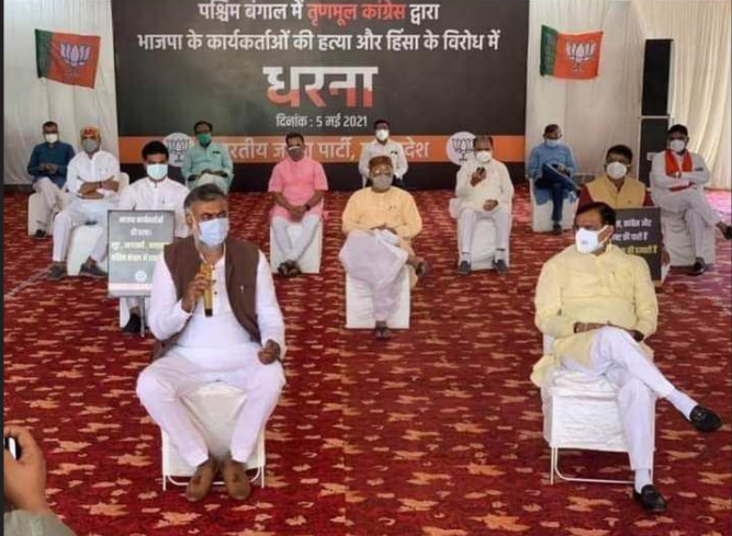
ભગવા શાસકો ના નાટકો તો જુવો? કોણ આવા તેમના ફતવા અને નીંટકો હવે સ્વીકારશે...તાકાત હોય તો બંગાળ જાવો ને જેમ બંગાર ઉધરાવવા સરકારી ખર્ચે ગયા હતા અને લોકો એ ઉંધી પૂછડિયે ભગાડ્યા હતા.

ગરીબોં કો એમ્બુલેન્સ તક નસીબ નહીં શવ લે જાને તબ પ્રદર્શન ક્યોં નહીં ?