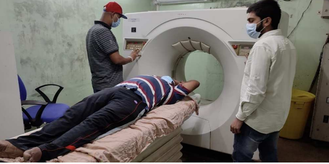
પરિસ્થિતિમાં તેમને ત્યાં કોવિડ-૧૯ ના પરિશ્લેષ માટે HRCT થતાં હોય છે. સદર HRCT નો ચાર્જ આ સેન્ટર દ્વારા પેશન્ટ પાસેથી અગાઉ રૂ. ૩૦૦૦ લેવામાં આવતો હતો. જે અંગે જિલ્લા વહિવટીતંત્ર દ્વારા કરાયેલા પ્રયાસોથી સદરહું સેન્ટરના તબીબ-સંચાલક તરફથી તેમાં રૂ. ૫૦૦ નો ઘટરૂ કરી નર્મદા જિલ્લા ની પ્રજા ને રાહત આપવામાં આવી છે હવે પછી પેશન્ટ પાસેથી ફક્ત રૂ. ૨૫૦૦ નો જ ચાર્જ લેવામાં આવશે. આ સિવાય આ સેન્ટર તરફથી વધારાનો કોઈ ચાર્જ લેવામાં આવતો નથી અને દરેક પેશન્ટને તે બાબતની સ્પષ્ટ આપવામાં આવશે તે મતલબનું લેખિત અનુમોદન નર્મદા જિલ્લા પ્રશાસન-જિલ્લા આરોગ્યતંત્રને નર્મદા ડાયગ્નોસ્ટીક્સ સેન્ટર તરફથી ગરીબ પ્રજા ને રાહત મળતા આનંદ ની લાગણી ફેલાઈ છે તસવીર : જ્યોતિ જગતાપ, રાજપીપલા

રાજપીપલા- તા ૫ નર્મદા જિલ્લો અતિપછાટ અને આદિવાસી જિલ્લો છે અહીં મોટાભાગે લોકો ખેતી પર નિર્ભર છે ત્યારે હાલ કોરોના મહામારી જિલ્લા માં વધી રહી છે અને આ કોરોના ટેસ્ટ મોટિરિપીડ, તુનટ ટેસ્ટ સરકાર દ્વારા મફત માં કરવામાં આવે છે જોકે કોરોના પોઝિટિવ માં કેટલાક લોકો ને સીધી અસર ફેફસા પર પડતી હોય છે જેનું પ્રમાણ જોવા HRCT (સિટીસ્કેન) ટેસ્ટ ની જરૂર પડે છે જે માટે રાજપીપલા એક માત્ર નર્મદા ડાયગ્નોસ્ટીક્સ સેન્ટર પર કરવામાં આવે છે જેનો ચાર્જ ૩૦૦૦ રૂપિયા હતા પરંતુ હાલ જિલ્લા કલકેટર દ્વારા આમા પણ રાહત કરવામાં આવ્યો છે રાજપીપલામાં વિજય પ્રસૂતિગૃહ ખાતે કાર્યરત નર્મદા ડાયગ્નોસ્ટીક્સ સેન્ટર ખાતે હાલની પેડનેમિક