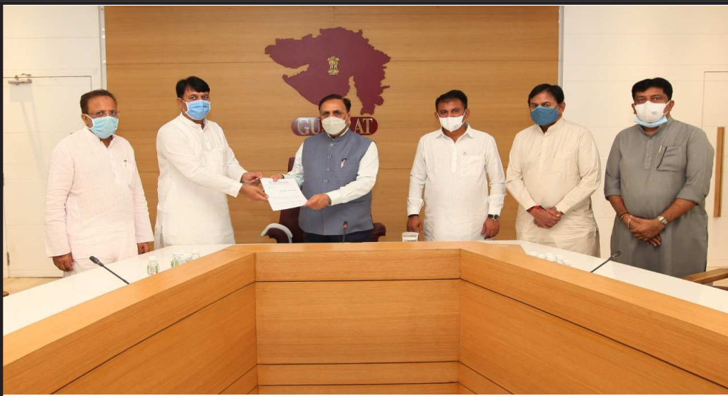
ગુજરાતમાં કોરોનાની બેકાબુ પરિસ્થિતિમાં લોકોના જીવ બચાવવા માટે સરકાર તાત્કાલિક ધોરણે હોસ્પિટલમાં બેડ, ઓક્સિજન, ઇન્જેક્શન, વેન્ટિલેટર, સ્ટાફ ઉપલબ્ધ કરાવે, ટેસ્ટિંગ માટે ની કીટ અને લેબોરેટરી વધારો, મેડિકલ અને પેરા મેડિકલ સ્ટાફની કાયમી ભરતી કરો, એમ્બ્યુલન્સ વધારો, ગરીબ જરૂરિયાત મંદ લોકોને આર્થિક સહાય પેકેજ આપવામાં આવે જેવી વિવિધ પ્રજાના જીવ બચાવવા અને સુખાકારી માટેની માંગણી સાથે કોંગ્રેસ પક્ષના પ્રતિનિધિ મંડળ દ્વારા મુખ્યમંત્રીશ્રી વિજયભાઈ રૂપાણીને આવેલ આપવામાં આવ્યું.