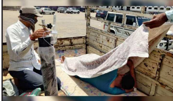
ગામડા માં પ્રાથમિક સારવાર નથી સરકાર સભ સલામત ના બહાણાં ફૂંકે ખાનગી કે સિવિલ માં જગ્યા નથી ત્યારે સામાન્ય માણસ તેમના પરિવાર જન નો જીવ બચાવવા આમતેમ ભટકે છે છેલ્લા એકાદ અઠવાડિયા થી માણસ ને બેડ ન મળવા ને સીવીલ ની કતાર માં ઉમા રહી ને રોજ ના અનેક લોકો ના જીવ જર્દ રહ્યા છે એવોજ એક કિસ્સો બેકે આવા તો અનેક છે હોસ્પિટલ એડમિટ થવા ની રાહ માં પુલ્લા વાહન માં કપડું નાખી ને બાટલો હાથ માં ખાલી ને સગ્ગા વહાલા ને બચાવવા ભટકે છે છતાં ગુજરાત માં સભ સલામત ના બહાણાં હજારો લોકો એ જીવ ખોઈ દીધા છે ને છતાં જીવ સે ગુજરાત જીવ રહેશે તો જીવ સે ગુજરાત બીજું શું