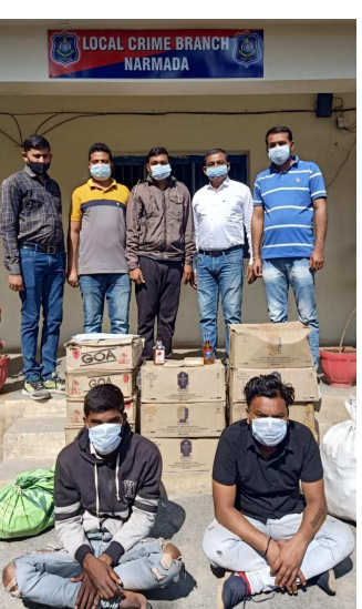
ગાડીની વોચના ઉભા હતા, તે દરમિયાન ખાતમીવાળી બલેનો ગાડી મોવી તરફથી આવતા તેને ઉભી રાખવાનો હાથથી ઈશારો