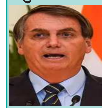
ન્યુ દિલ્હી, તા. ૨૩

ભારત અને બ્રાઝીલની વચ્ચે મિત્રતાભર્યા સંબંધ જગજાહેર છે પરંતુ રાષ્ટ્રપતિ જેયર બોલ્સોનારોનો અહીં અલગ જ જોડાણ દેખાય છે. ગયા વર્ષે હનુમાન જયંતી પર બોલ્સોનારોને એ ભારતે જ્યારે હાઈડ્રોક્લોરોક્વીન મોકલી તો તેમણે સંજીવની બુટ્ટી ગણાવી હતી. હવે આ ઘાતક વાયરસની રસી પહોંચાડવા પર ફરી એક વખત ભગવાન હનુમાનને યાદ કર્યા છે. ભારતને કોરોના વાયરસ રસીના ૨૦ લાખ ડોઝ મળ્યા બાદ બ્રાઝીલના રાષ્ટ્રપતિ જેયર બોલ્સોનારોએ ટ્વીટ કરી. તેમણે ભગવાન હનુમાનની સંજીવની બુટ્ટી