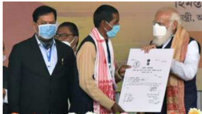
શિવસાગર, તા. ૨૩

વડાપ્રધાન નરેન્દ્ર મોદીએ આસામમાં એક લાખ સ્થાનિકોને જમીન પટ્ટા આપવાનું ઉદ્ઘાટન કરતા ઐતિહાસિક જેરેંગા પાથર ખાતે ૧૦ લોખોને જમીનના પટ્ટાના પ્રમાણપત્ર સોંપ્યા હતા. પીએમ મોદીએ આ પ્રસંગે અગાઉની રાજ્ય સરકાર પર નિશાન સાધતા કહ્યું કે અગાઉની સરકારોએ અહીંના લાખો સ્થાનિકો પ્રત્યે દુર્લ્ભ સેવ્યું હતું અને તેમને જમીનના અધિકારોથી વંચિત રાખ્યા હતા. ભાજપના નેતૃત્વમાં આસામની સરકાર સ્થાનિકોને તેમના હક અને જમીન અધિકાર આપવા પ્રતિબદ્ધ છે. વડાપ્રધાને કરેલા ઉદ્ઘાટન કાર્યક્રમ અંતર્ગત એક લાખ લોકોને જમીન પટ્ટાના પ્રમાણપત્રો અપાશે. આસામમાં જ્યારે સરબંદા સોનોવાલ સરકારે શાસનની ધૂરા સંભાળી ત્યારે છ લાખથી વધુ સ્થાનિક પરિવારો પાસે તેમની જમીન માટેનો કોઈ જ કાયદાકીય અધિકાર નહોતો. છેલ્લા થોડા વર્ષોમાં બે લાખ પરિવારોને જમીન પટ્ટો આપવાની કામગીરી