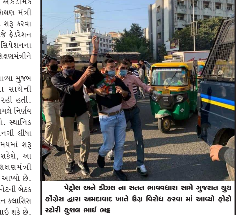
પેટ્રોલ અને ડીઝલ ના સતત ભાવવધારા સામે ગુજરાત યુથ કોંગ્રેસ દ્વારા અમદાવાદ ખાતે ઉગ્ર વિરોધ કરવા માં આવ્યો ફોટો સ્ટોરી કુશલ ભાઈ ભટ્ટ

કાર્યાલય ખાતે વિમોચન પ્રસંગે પ્રદેશ પ્રમુખ સી.આર.પાટીલે જણાવ્યું હતું કે, સુરતના વિકાસની ગતિ દેશના અન્ય શહેરો કરતાં અનેકગણી વધારે છે. આ પ્રસંગે તેમણે કહ્યું હતું કે, મ્યુનિ. ચૂંટણીમાં દરેક વોર્ડમાંથી ૧૦૦થી વધુ દાવેદારો આવે તેમ છે. પણ સરકારની યોજના લોકો સુધી પહોંચાડવાની કામગીરી કોણે કરી છે? અને કોને લાભ મળ્યો છે તે માટે દાવેદારી વેળા આપવી પડશે. તેમણે એવી ટીપ્પણી પણ કરી હતી કે, પંચાયત વર્ષથી વધુ ઉંમર ધરાવનારોએ દાવેદારી માટે ફોર્મ ભરવું નહીં.