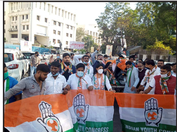
યુથ કોંગ્રેસ દ્વારા પેટ્રોલ ડીઝલ ના ભાવ વધારા સામે આક્રમક દેખાવો બાદ ધરપકડ બાદ છુટકારો..