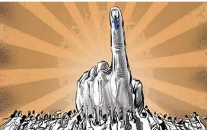
ગાંધીનગર, તા. ૨૩

ગુજરાતમાં સ્થાનિક સ્વરાજની ચૂંટણીને લઈ મોટા સમાચાર મળી રહ્યા છે. આજે ચૂંટણી પંચે મોટી જાહેરાત કરી છે. રાજ્ય ચૂંટણી પંચ દ્વારા તૈયારીઓ આરંભી દેવામાં આવી છે. બે તબક્કામાં સ્થાનિક સ્વરાજની ચૂંટણીઓ યોજાશે. પ્રથમ તબક્કામાં મહાનગરપાલિકાની ચૂંટણી યોજાશે. ૨૧ ફેબ્રુઆરીએ પ્રથમ તબક્કાનું મતદાન થશે, જ્યારે બીજા તબક્કાનું મતદાન ૨૮ ફેબ્રુઆરીએ થશે. મહાનગર પાલિકાની ચૂંટણી ૨૧ ફેબ્રુઆરીએ અને ૮૧ નગર પાલિકાની ચૂંટણી ૨૮ ફેબ્રુઆરીએ તથા ૩૧ જિલ્લા પંચાયત, ૨૩૧ તાલુકા પંચાયતની ચૂંટણી યોજાવા તઈ રહી છે. આજે ૨૩ જાન્યુઆરીના રોજ ગુજરાત ચૂંટણી પંચે સ્થાનિક સ્વરાજની ચૂંટણીની જાહેરાત કરી છે. જેમાં ચૂંટણી માટે જાહેરનામું પ્રસિદ્ધ કરવાની તારીખ