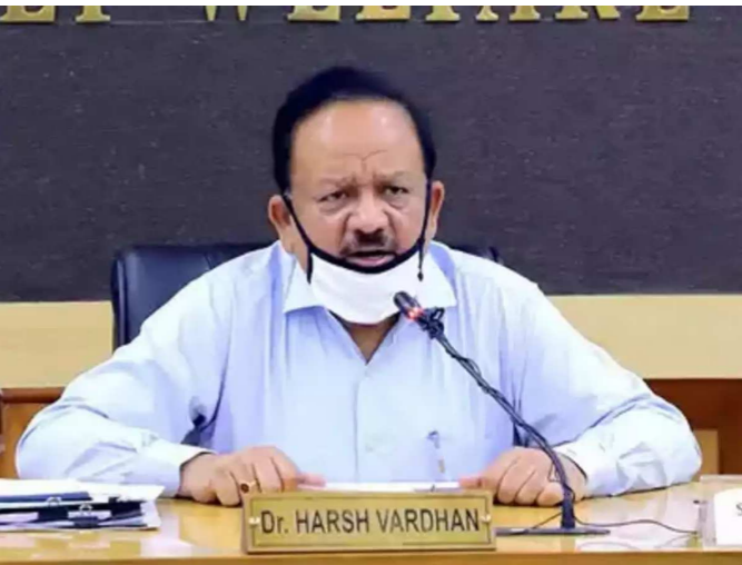
ધોરણે રસી આપવા માટે વિવિધ માપદંડો વિકસાવ્યા છે, જે મુજબ પ્રાથમિકતાના ધોરણે કોરોના સામે લડવામાં સૌથી વધુ જોખમ હોય તેવા ડોક્ટર્સ, નર્સ, પોલીસ સહિત ફંટલાઈન વોરિયર્સને પહેલાં કોરોનાની રસી અપાશે. ભારતમાં ૨૭ કરોડથી વધુ લોકોને રસી આપવાની સરકારની યોજના છે. ફંટલાઈન વોરિયર્સ ઉપરાંત ડાયાબિટીસ, ડોક્ટર્સ, નર્સ, પોલીસ સહિત ફંટલાઈન વોરિયર્સને પહેલાં કોરોનાની રસી અપાશે. ભારતમાં ૨૭ કરોડથી વધુ લોકોને રસી આપવાની સરકારની યોજના છે. ફંટલાઈન વોરિયર્સ ઉપરાંત ડાયાબિટીસ, અસાધ્ય બિમારી, શ્વાસોચ્છ્વાસની બીમારી ધરાવતા લોકોને પહેલાં રસી આપવામાં આવશે.

અથવા અન્ય ગંભીર બીમારીથી પીડિત લોકો હશે. સ્વાસ્થ્ય મંત્રીએ લોકોને અફવાઓ પર ધ્યાન ન આપવાની અપીલ કરી છે. આ પહેલા પ્રધાનમંત્રી મોદીએ પણ વેક્સિનને લઈને અફવાઓથી બચવાની ભલામણ કરી હતી. હર્ષવર્ધને કહ્યું, હું લોકોને અપીલ કરું છું કે અફવાઓ પર ધ્યાન ન આપે. વેક્સિનની સુરક્ષા અને તેની ઉપયોગિતા સુનિશ્ચિત કરવી અમારી પ્રથમ પ્રાથમિકતા છે. કેન્દ્રીય સ્વાસ્થ્ય મંત્રી હર્ષવર્ધને શનિવારે દિલ્હીના ચુરુ તેગબહાદુર હોસ્પિટલમાં પહોંચીને કોરોના વેક્સિનના ડ્રાઈ રનનું નિરીક્ષણ કર્યું હતું. જણાવી દઈએ કે દેશના તમામ રાજ્યો અને કેન્દ્ર શાસિત પ્રદેશોમાં કુલ ૧૧૬ જિલ્લામાં કોરોના વેક્સિનનું ડ્રાઈ રન કરવામાં આવ્યું હતું. આ માટે કુલ ૨૫૯ વેક્સિનેશન બૂથ બનાવવામાં હતા. હકીકતમાં ડ્રાઈ રનમાં કોઈ વેક્સિનનો ઉપયોગ કરવામાં નથી આવી રહ્યો પરંતુ માત્ર તેની તપાસ કરવામાં આવી રહી છે કે વેક્સિનેશન માટે બનાવવામાં આવેલી યોજના કેટલી ઉપયોગી છે. ભારતમાં કોરોનાની રસીની આતુરતા પૂર્વક રાહ જોવાઈ રહી છે અને નિષ્ણાતોની પેનલે શુક્રવારે એક બેઠકમાં ઓક્સફર્ડ-એસ્ટ્રાજેનેકાની રસીને મંજૂરી આપી દીધી છે ત્યારે એઈમ્સના રિસેક્ટર ડૉ. રણદીપ ગુલેરિયાએ જણાવ્યું હતું કે, રસીના પહેલા અને બીજા ડોઝ વચ્ચે ૨૮ દિવસનું અંતર સલામત છે. ડૉ. ગુલેરિયાએ જણાવ્યું હતું કે, નિષ્ણાતોની સમિતિના અધ્યક્ષ તરીકે અમે પ્રાથમિકતાના