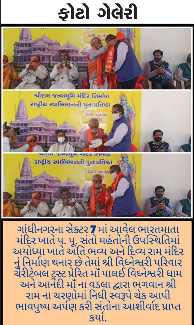
ગાંધીનગરના સેક્ટર 7 માં આવેલ ભારતમાતા મંદિર ખાતે પ. પૂ. સંતો મહંતોની ઉપસ્થિતિમાં અયોધ્યા ખાતે અંતિ ભવ્ય અને દિવ્ય રામ મંદિર નું નિર્માણ થનાર છે તેમાં શ્રી વિઠ્ઠલજી પરિવાર ચેરિટેબલ ટ્રસ્ટ પ્રેરિત માં પાલઈ વિઠ્ઠલજી ધામ અને આનંદી માં ના વડલા દ્વારા ભગવાન શ્રી રામ ના ચરણોમાં નિધી સ્વરૂપે ચેક આપી ભાવપુષ્પ અર્પણ કરી સંતોના આશીર્વાદ પ્રાપ્ત કર્યાં.