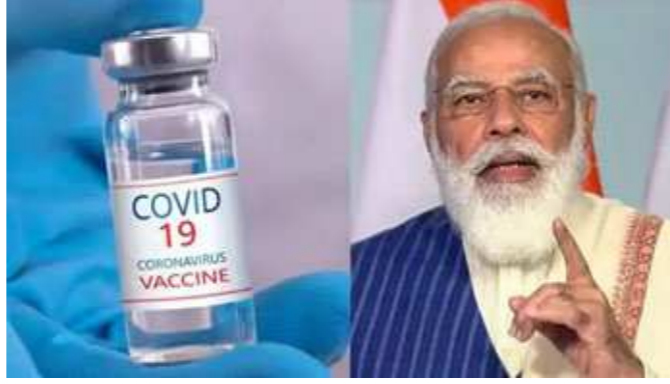
કેન્દ્રો પર રસીકરણ કરવામાં આવશે. દરેક રસીકરણ સત્રમાં વધુમાં વધુ ૧૦૦ લાભાર્થીઓ

ન્યુ દિલ્હી, તા. ૧૫ વડા પ્રધાન નરેન્દ્ર મોદી દેશમાં ૧૬ જાન્યુઆરીએ વીડિયો કોન્ફરન્સિંગ દ્વારા કોવિડ-૧૯ સામેના રસીકરણને શરૂ કરાવશે અને દેશના બધા રાજ્ય તેમ જ કેન્દ્રશાસિત પ્રદેશમાં સ્વદેશી બનાવટની બે રસી આપવાનું શરૂ થશે. વડા પ્રધાનની ઓફિસે એક નિવેદનમાં જણાવ્યું હતું કે 'જન ભાગીદારી'ની સાથે કોરોના સામેનો રસીકરણનો વિશ્વવનો સૌથી મોટો કાર્યક્રમ ૧૬ જાન્યુઆરીએ શરૂ કરવા માટે બધી પૂર્વતૈયારી થઈ ગઈ છે. વડા પ્રધાન દેશભરમાં ૧૬ જાન્યુઆરીએ સવારે ૧૦.૩૦ વાગ્યે રસીકરણનો આ કાર્યક્રમ વીડિયો કોન્ફરન્સિંગથી શરૂ કરાવશે. ૧૬ જાન્યુઆરીએ દેશમાં કોવિડ-૧૯ વિરુદ્ધ રસીકરણ અભિયાનના પ્રથમ દિવસે ૨,૮૩૪ કેન્દ્રો પર લગભગ ત્રણ લાખ આરોગ્ય કર્મચારીઓને રસી આપવામાં આવશે. ૫૦૦૦ થી વધુ