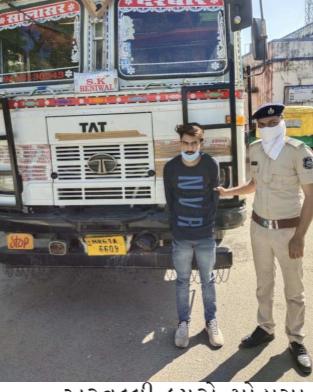
અરવલ્લી બ્યુરો મોડરસા અરવલ્લી જીલ્લામાં