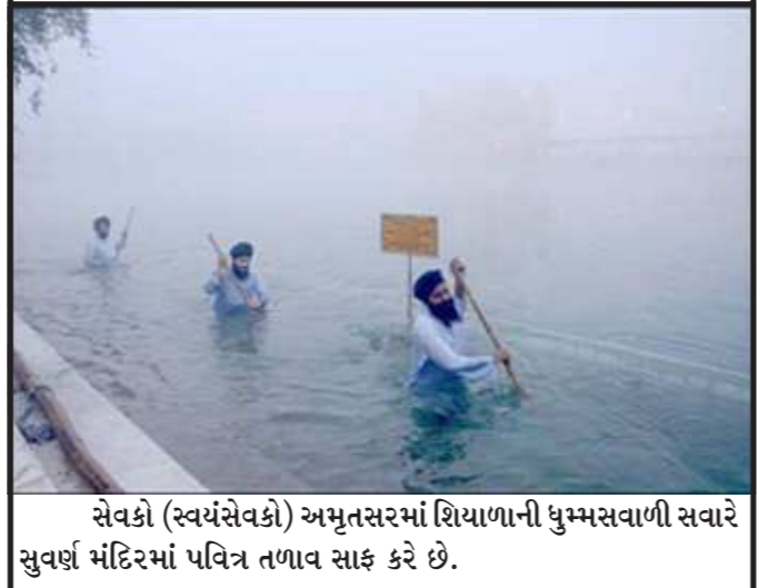
સેવકો (સ્વયંસેવકો) અમૃતસરમાં શિયાળાની ધુમ્મસવાળી સવારે સુવર્ણ મંદિરમાં પવિત્ર તળાવ સાફ કરે છે.