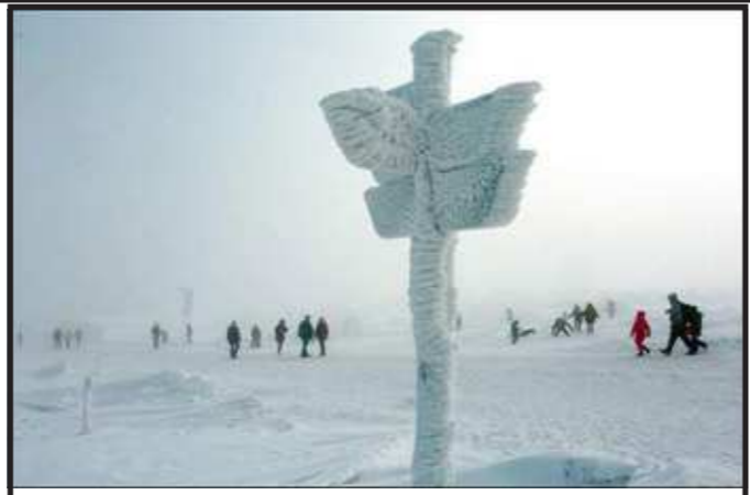
લોકો શિવકોના બ્રોકન પર્વત પર બરફથી ઢંકાયેલ સાર્ઠનપોસ્ટ પર પસાઈથી જતા જોવા મળે છે.

અમરાવતી,તા.૩ આંધ્ર પ્રદેશમાં મંદિરો પર થઈ રહેલા હુમલાને જોતા એક મહત્વનો નિર્ણય લઈને તેલુગુ દેશમ પાર્ટીનાં નેતા અશોક ગજપતિ રાજૂને રાજ્યનાં ત્રણ મંદિરોનાં અધ્યક્ષ પદેથી હટાવી દીધા છે, એક સત્તાવાર નિવેદનમાં સરકારે કહ્યું કે પુર્વ કેન્દ્રીય પ્રધાન અશોક ગજપતિને મંદિરોનાં પોતાના કર્તવ્યોનું નિર્વહન અને સુરક્ષા મુદ્દે સારી રીતે સંભાળી ન શકવાનાં કારણે તેમને હટાવવામાં આવી રહ્યા હોવાનું કારણ આપ્યું છે. અશોક ગજપતિ રાજૂ વિજયનગરમ જિલ્લામાં શ્રી રામ સ્વામી દેવસ્થાનમમાં ભગવાન રામની મુર્તિને વિધ્વંસ થતી રોકવા માંટેનાં પગલા લેવામાં નિષ્ફળ રહ્યા છે. રાજ્યની જગન મોહન રેડ્ડીનાં નેતૃત્વમાં રાજ્ય સરકારે કહ્યું કે તે આ મામલે સાવધાનીપુર્વક તપાસ બાદ સરકારનાં ત્રણેય મંદિરોનાં ટ્રસ્ટ બોર્ડનાં અધ્યક્ષ પદેથી અશોક ગજપતિ રાજૂને હટાવી દીધા, જે ત્રણ મંદિરોનાં અધ્યક્ષપદેથી રાજૂને હટાવવામાં આવ્યા છે તે છે શ્રી રામ સ્વામી દેવસ્થાનમ, શ્રી પિડિતલ્લી અમ્માવરી દેવસ્થાનમ, અને શ્રી મંરેશ્વર સ્વામી મંદિરનો સમાવેશ થાય છે.