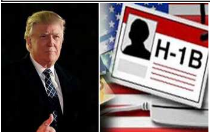
વોશિંગ્ટન,તા.૧ અમેરિકાના રાષ્ટ્રપતિ ડોનાલ્ડ ટ્રમ્પ એ નવા વર્ષ ૨૦૨૧ના રોજ ઈમિગ્રન્ટ વર્કસને ઝાટકો આપતા ત્રણ મહિના માટે અગાઉ લાગુ કરેલા વર્ક વિઝા પર પ્રતિબંધ લંબાવી દીધો છે. હવે આ પ્રતિબંધ ૩૧ માર્ચ ૨૦૨૧ સુધી અમલમાં રહેશે. રાષ્ટ્રપતિ ટ્રમ્પે ગુરુવારના રોજ એ આદેશ પર હસ્તાક્ષર કર્યા હતા જેમાં કોરોનાવાયરસ મહામારીના લીધે

અમેરિકામાં કામ કરવા માટે વિદેશી લોકો દ્વારા ઉપયોગમાં લેવાતા કેટલાંય અસ્થાયી વીઝાને રોકી દેવામાં આવ્યા છે, જેમાં એચ-૨બી કાર્યક્રમ પણ સામેલ છે જે બિન કૃષિ મોસમી શ્રમિકો માટે રજૂ કરાય છે. આ સિવાય એચ-૧બી વીઝાને આઈટી ક્ષેત્રના લોકોની વચ્ચે ખૂબ લોકપ્રિય છે તે પણ સામેલ છે. પ્રતિબંધિત કરાયેલા વીઝામાં J-1 વીઝા પણ સામેલ છે જે સાંસ્કૃતિક આદાન-પ્રદાન માટે અપાય છે. એચ-૧બી અને એચ-૨બી ધારકોના જીવનસાથી માટે વીઝા અને કંપનીઓ માટે L વીઝા જે અમેરિકામાં કર્મચારીઓને સ્થળાંતરિત કરવા માટે રજૂ કરાય છે તેને પણ સસ્પેન્ડ કરાયા છે. ટ્રમ્પે નિવેદન આપ્યું છે કે આ ઉદઘોષણા ૩૧ માર્ચ, ૨૦૨૧ના રોજ સમાપ્ત થશે અને જરૂરિયાત મુજબ ચાલુ રાખવામાં આવી શકે છે. ૩૧ ડિસેમ્બર, ૨૦૨૦ ના ૧૫ દિવસની અંદર અને ત્યારબાદ દર ૩૦ દિવસોમાં જ્યારે આ ઘોષણા અસરકારક છે. જરૂર પડવા પર ગૃહ સચિવ, રાજ્ય સચિવ અને શ્રમ સચિવનો સંપર્ક કરીને તેઓ કોઈપણ પ્રકારના સંશોધનની ભલામણ કરી શકે છે. ટ્રમ્પના આ નિર્ણયથી હજારો ભારતીય આઈટી પ્રોફેશનલ્સ અને અમેરિકા ઉપરાંત ભારતીય કંપનીઓ પર પ્રતિકૂળ અસર થવાની શક્યતા નકારી કઠાતી નથી. ટ્રમ્પે ૨૦૨૦ના એપ્રિલની ૨૨મીએ અને ત્યારબાદ જૂનની ૨૨મીએ વિવિધ વીઝા પર પ્રતિબંધો લાદવાની જાહેરાત કરી હતી. એ આદેશ ડિસેમ્બરની ૩૧મીએ આપોઆપ રદ થવાનો હતો. એ રદ થાય એ પહેલાં ટ્રમ્પે ૩૧મીએ જ આ નીતિ ૨૦૨૧ના માર્ચ સુધી લંબાવવાની જાહેરાત કરીને હજારો આઈટી પ્રોફેશનલ્સને આંચકો આપ્યો હતો.