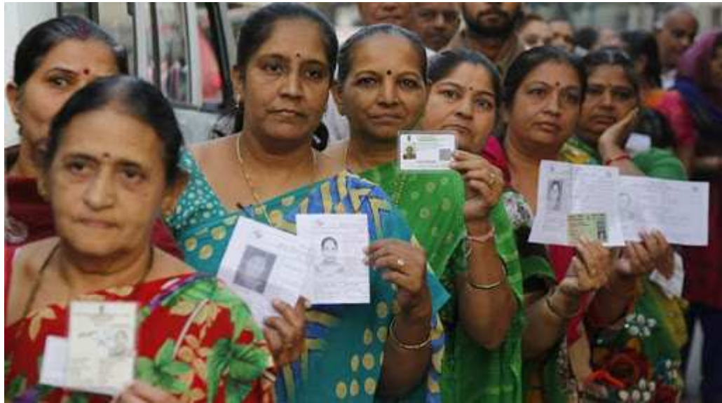
ગાંધીનગર,તા.૫ સ્વરાજની ચૂંટણીઓના પડઘમ ગુજરાતમાં સ્થાનિક વાગી ગયા છે. રાજ્ય ચૂંટણી પંચે મહાનગરપાલિકા, ૩૧ જિલ્લા પંચાયત, ૨૩૧ તાલુકા પંચાયત