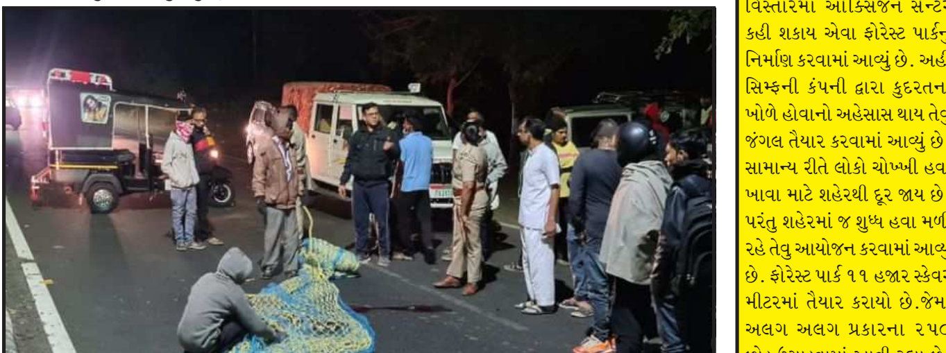
અકસ્માત: હાલોલ-પાવાગઢ રોડ પર અજાણ્યા વાહનની અડફેટે આવતાં દીપડાને ગંભીર ઈજાઓ પહોંચી