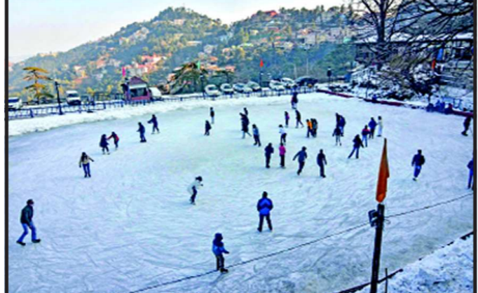
સિમલામાં થયેલી ભારે હિમવર્ષા બાદ પર્યટકોએ આઈસ સ્કેટિંગનો આનંદ માણ્યો હતો.