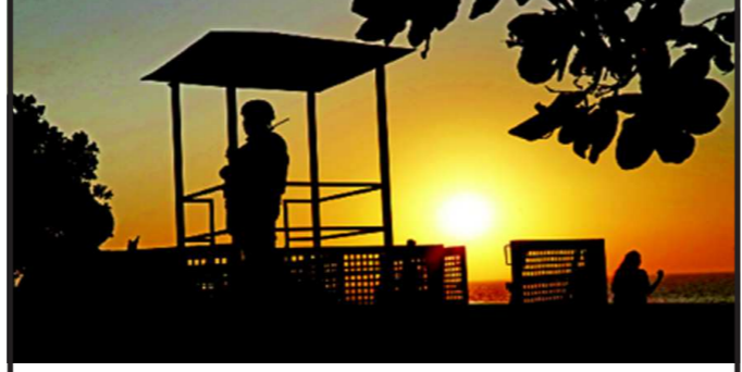
નવા વર્ષની ઉજવણી દરમિયાન કોઈ અઘટિત ઘટના ન બને તે માટે પોલીસ ચાંપતી નજર રાખી રહી છે. તસવીરમાં નરીમાન પોઈન્ટ ખાતેની ચેક પોસ્ટમાં તહેનાત પોલીસનો જવાન નજરે પડે છે.