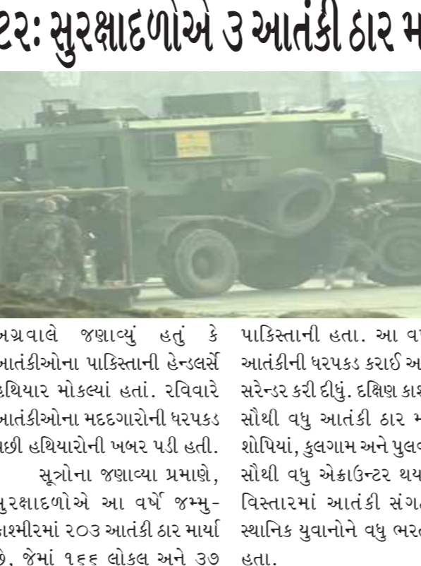
અગ્રવાલે જણાવ્યું હતું કે આતંકીઓના પાકિસ્તાની હેતુલક્ષે અગ્રવાલે જણાવ્યું હતું કે આતંકીઓના પાકિસ્તાની હેતુલક્ષે અગ્રવાલે જણાવ્યું હતું કે આતંકીઓના પાકિસ્તાની હેતુલક્ષે

એરટેલના શેર લાલ નિશાન પર બંધ થયા છે. જો આપણે સેક્ટોરલ ઈન્ડેક્સ પર નજર કરીએ તો આજે બેંકો, ફાર્મા, ખાનગી બેંકો અને પીએસયુ બેંકો સિવાયના તમામ ક્ષેત્રો લીલા નિશાન પર બંધ થયા છે. આમાં ફાઈનાન્સ સર્વિસીસ, આઈટી, રિયલ્ટી, એફએમસીજી, મીડિયા, ઓટો અને મેટલ શામેલ છે. આજે એશિયાઈ બજારોમાં હોંગકોંગનો હૅન્સસૅંગ ઈન્ડેક્સ ૩૦૭ અંક(૧.૪૯ ટકા)ના વધારા સાથે ૨૬૯૬૫ પર ફારોબાર કરી રહ્યો છે. આ સિવાય નેસ્ડેક ઈન્ડેક્સ પણ ૪૯ અંકના ઘટાડા સાથે ૧૨૮૫૦ પર બંધ થયો હતો.