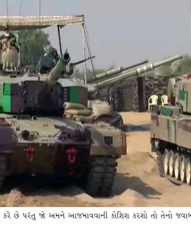
અને સમજાવવાની નીતિ પર વિશ્વાસ કરે છે પરંતુ જો અમને આજમાવવાની કોશિશ કરશો તો તેનો જવાબ એટલો જ પ્રચંડ મળશે.

પરસ્ત કરી નાખ્યો. મેજર કુલદીપ સિંહ ચાંદપુરના નેતૃત્વમાં દુશ્મનોને છે કે જે લોકોને આજે પણ યાદ છે.' જ્યારે પણ સૈન્યની કુશળતાના ઈતિહાસને વિશે લખવા કે વાંચવામાં આવશે ત્યારે 'બૈટલ ઓફ લોંગેવાલા'ને યાદ કરવામાં આવશે. આ તે સમય હતો કે જ્યારે પાકિસ્તાની સેના બાંગ્લાદેશની જનતા પર ત્રાસ ગુજારી રહી હતી. તેમની આ હરકતોથી પાકિસ્તાનનો છુપાયેલો ચહેરો ઉજાગર થઈ રહ્યો હતો. આ બધા પરથી વિશ્વનું ધ્યાન હટાવવા માટે પાકિસ્તાને આપણાં દેશની પશ્ચિમી સીમા પર મોરચો ખોલી દીધો. તેઓને લાગતું હતું કે, આવું કરીને બાંગ્લાદેશના પાપને દબાવી દઈશું પરંતુ પાકિસ્તાનને લેવાના દેવા પડી ગયા. આ પોસ્ટ પર પરાક્રમની ગુંજે દુશ્મનોનો હોંસલો