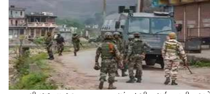
શ્રીનગર, તા. ૧૦ જમ્મુ કશ્મીરના શોપિયા વિસ્તારમાં સિક્ચોરિટી દળોએ બે આતંકવાદીને ઠાર કર્યા હતા. આ વિસ્તારમાં બીજા આતંકવાદી છૂપાયા હોય તો તેમની તલાશી ચાલુ હતી. સિક્ચોરિટી પ્રવક્તાએ જણાવ્યા મુજબ શોપિયાના કુટપોરા વિસ્તારમાં આતંકવાદીઓ છૂપાયા હોવાની ખાતમી મળતાં ૩૪ રાજસ્થાન રાયફલ્સ અને કેન્દ્રીય અનામત પોલીસ દળની ટૂકડીઓ

ત્યાં ઘસી ગઈ હતી અને આતંકવાદીઓને શરણે થવાની ચેતવણી આપી હતી. એના જવાબમાં સામેથી ગોળીબાર શરૂ થયા હતા. સિક્ચોરિટી દળોએ વળતા ગોળીબાર કર્યા હતા જેમાં બે આતંકવાદી ઠાર થયા હતા. આ બંનેની ઓળખ કરવાની હજુ બાકી હતી. આ વિસ્તારમાં કદાચ બીજા આતંકવાદી છૂપાયા હોઈ શકે એવી શક્યતા પરથી સિક્ચોરિટી દળોએ સઘન તપાસ શરૂ કરી હતી. દરમિયાન, ભારતીય લશ્કરના આકાશોએ એવી સૂચના આ આતંકવાદીઓને આપી હતી કે ભરફ પડવાનો શરૂ થઈ જાય અને ઘુસણખોરીના માર્ગો બંધ થઈ જાય એ પહેલાં બંને તેટલા આતંકવાદીઓને કશ્મીર વેલીમાં ઘુસાડી દેવા. બોર્ડર સિક્ચોરિટી ફોર્સના વધારાના ડાયરેક્ટર જનરલ સુરિન્દર પવારે કહ્યું હતું કે લોથિંગ પેડ્ડ પર અહીંસોથી ત્રણસો આતંકવાદીઓ દેશમાં ઘુસવા માટે તૈયાર બેઠાં હોવાની માહિતી મળી હતી. આપણા સિક્ચોરિટી દળો સતર્ક હતાં.