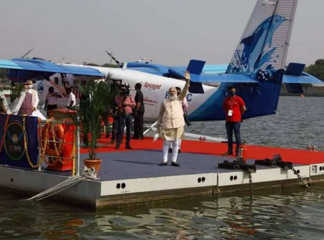
કેવડિયા/અમદાવાદ,તા.૩૧ કેવડિયાસ્થિત સ્ટેચ્યુ ઓફ યુનિટી ખાતે વડાપ્રધાન મોદીએ કેવડિયાથી અમદાવાદ સી-પ્લેન

લાઈફ જેકેટ અંગે માહિતી અપાઈ હતી. આ પહેલાં મોદીએ આજે રાષ્ટ્રીય એકતા દિવસની ઉજવણીમાં ભાગ લીધો હતો અને અહીં વિડિયો કોન્ફરન્સિંગ દ્વારા સિવિલ સર્વિસ ટ્રેની ઓફિસરોને પણ સંબોધન કર્યું હતું. ઉલ્લેખનીય છે કે, પીએમ મોદીએ સી પ્લેનમાં અમદાવાદથી કેવડિયાની સફર કરી હતી. ત્યારે આ સી પ્લેન આકર્ષણનું કેન્દ્ર બન્યું હતું. કેવડિયા ખાતે તળાવ નંબર ૩ થી સી પ્લેનને ઉડાન ભરી હતી, જેના પ્રથમ મુસાફર પીએમ મોદી બન્યા હતા. કેવડિયાથી પીએમ મોદીને નીકળેલું સી પ્લેન ૫૦ મિનિટમાં અમદાવાદ પહોંચ્યું હતું. નર્મદા નદીમાંથી ટેકઓફ થયેલુ સી