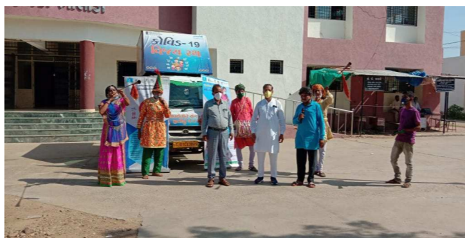
વિજય રથ બનાસકાંઠા, પાટણ, મહેસાણા, સાબરકાંઠા જિલ્લાના શહેરી તેમજ ગ્રામીણ વિસ્તારો માં ફરી જાગૃતિ સંદેશ ફેલાવી રહ્યો હતો આજ થી અરવલ્લી જિલ્લા ના ભિલોડા ગુજરાતના દરેક નાગરિક સુધી પહોંચાડવામાં આવી રહી છે.

આગામી દિવસો મા અરવલ્લી જિલ્લાના અનેક વિસ્તારો મા પણ જનજાગૃતિ ફેલાવશે આ પ્રસંગે જિલ્લા વહીવટી તંત્ર દ્વારા પૂરો સહયોગ સાંપડી રહ્યો છે. સામાજિક અંતર જળવાય એનું ધ્યાન રાખીને રથ પર માર્યાદિત સંખ્યામાં માત્ર ૪ કલાકારો પોતાની વિવિધ કલા જેવી કે ભવાઈ, ડાયરો, નાટક, જાદુ વગેરે દ્વારા ખૂબજ સહજરીતે અને સમજ શકાય તેવી ઢાળવી શૈલીમાં જાગૃતતાના સંદેશ ફેલાવી રહ્યાં છે. રથમાં કોરોના વાયરસના