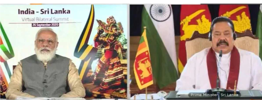
રાજપક્ષેએ પોતાના પ્રી-રેકોર્ડેડ ભાષણમાં કહ્યું, અમારી પ્રાથમિકતા હિન્દ મહાસાગર ક્ષેત્રમાં શાંતિ બનાવી રાખવાની

મહામારી દરમિયાન ભારતે અન્ય દેશોની સાથે મળીને જે રીતે કામ કર્યું, તે માટે હું આભાર વ્યક્ત કરું છું. તેમણે આગળ કહ્યું કે, એમટી ન્યૂ યાંચમાં જહાજ પર આગ ઠારવાના ઓપરેશનમાં બંને દેશો વચ્ચે વધુ સહયોગની તક પ્રદાન કરી. હિન્દ મહાસાગરમાં યીનની શક્તિ વધારવાની હરકતો વચ્ચે શ્રીલંકાએ સ્પષ્ટ કર્યું કે, તે આ સમુદ્રી ક્ષેત્રને કોઈના શક્તિ પ્રદર્શનનો ગઢ બનાવવાના વિરોધમાં છે. સંયુક્ત રાષ્ટ્રમાં શ્રીલંકાના રાષ્ટ્રપતિ ગોટબાયા