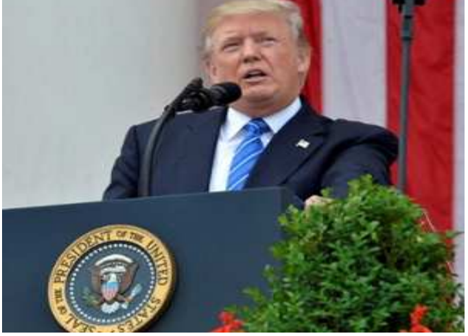
ટેસ્ટ માટે ત્રીજા તબક્કામાં પહોંચી ચૂકી છે. આ તેવી રસીની યાદીમાં સામેલ થઈ ચૂકી છે જે બનવાની ઘણી નજીક છે. લોકોને લાગી રહ્યું હતું કે, આ અશક્ત છે પરંતુ અમે અમેરિકામાં આ કરી બતાવ્યું. અમેરિકાના રાષ્ટ્રપ્રમુખે કહ્યું કે, કોવિડ-૧૯ની રસી બનાવવામાં ઘણો સમય લાગી શકતો હતો, પરંતુ તેમના તંત્રએ આ કામ થોડા મહિનામાં જ કરી બતાવ્યું. તેમણે કહ્યું કે, દેશના ૩૦ હજાર વોલેન્ટિયર્સ પર કોરોનાની રસીનું

વોશિંગ્ટન, તા. ૧ કોરોના વાયરસની રસી શોધવામાં દરેક દેશ લાગ્યો છે. આ વચ્ચે અમેરિકાને ટૂંક સમયમાં પુશ ખબર મળી શકે છે. કારણ કે, એસ્ટ્રાજેનેકાની કોરોના રસી ક્લિનિકલ ટ્રાયલના ત્રીજા તબક્કામાં પહોંચી ગઈ છે. વિશ્વના મોટાભાગના દેશોને જીવલેણ કોરોના વાયરસે ભરડામાં લઈ લીધા છે. વધી રહેલા મહામારીના કહેર વચ્ચે દરેક દેશ તેની રસી શોધવામાં લાગ્યો છે. આ દરમિયાન જગત જાદુદાર અમેરિકાના રાષ્ટ્રપ્રમુખ ડોનાલ્ડ ટ્રમ્પનું તેનાથી નીચેનો આંક સંકોચન દર્શાવે છે. ભારતનો મેન્યુફેક્ચરિંગ પીએમઆઈ માર્ચ બાદ પ્રથમ વખત પ૦ના સ્તરથી ઉપર જોવા મળ્યો છે જે વૃદ્ધિ દર્શાવે છે. આઈએચએસ માર્કિટમાં અર્થશાસ્ત્રી શ્રેયાપટેલે જણાવ્યું હતું કે ઓગસ્ટના આંકડા ભારતના મેન્યુફેક્ચરિંગ સેક્ટરમાં આવેલ સુધારાને દર્શાવે છે. તેનાથી બીજા છમાસિકમાં રિકવરીના સંકેત જોવા મળે છે.