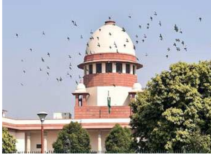
નોટિસને રદ કરવાનો અનુરોધ પછા કરવામાં આવ્યો હતો અને માંગ કરવામાં આવી હતી કે જ્યાં સુધી સ્થિતિ સામાન્ય ન થાય ત્યાં સુધી પરીક્ષા લેવામાં ન આવે. સુપ્રીમ કોર્ટે પોતાના ચુકાદામાં જણાવ્યું કે શું દેશમાં બધું રોકી દેવામાં આવે? શું આ કિંમતી

સમય મુજબ જ લેવામાં આવશે. જે મુજબ જેઈઈ મેઈન્સ ૧ સપ્ટેમ્બરથી ૬ સપ્ટેમ્બર સુધી તેમજ નીટ પરીક્ષા ૧૩ સપ્ટેમ્બરે યોજવામાં આવશે. દેશમાં ઝડપથી વધી રહેલા કોવિડ-૧૯ના કેસોની સંખ્યાના કારણે દેશના ૧૧ રાજ્યોના છાત્રોએ જેઈઈ મેઈન્સ અને નીટની પરીક્ષાઓ સ્થગિત કરવા માટે સુપ્રીમ કોર્ટમાં અરજી કરી હતી. અરજીમાં કોરોનાનો ઉલ્લેખ કરીને નેશનલ ટેસ્ટીંગ એન્ડ સીનીના ત્રણ જુલાઈની