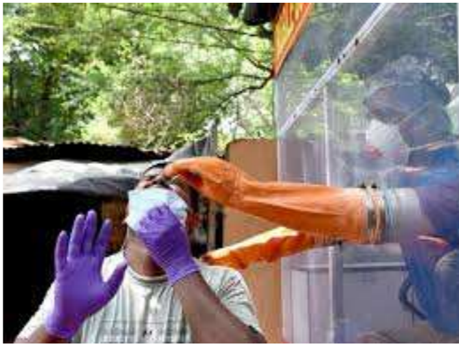
આવ્યા છે અને ૧૦૦૭ લોકોનાં દેશમાં કોરોના વાયરસને કારણે મોત નિપજ્યા છે. આ સાથે જ મોતનો કુલ આંક ૪૪૩૮૬ પર

અને તેને જ આગળ વધારતાં ૧૫ ઓગસ્ટે પીએમ મોદી આત્મનિર્ભર ભારતની તરફ નવી લકીર ખેંચશે. રક્ષામંત્રીએ કહ્યું કે, કોરોના સંકટને કારણે સાફ થઈ ગયું છે કે, દેશને આત્મનિર્ભર બનાવવાની જરૂર છે અને બહારની વસ્તુઓ પર નિર્ભર રહી શકતા નથી. ભારતની સરકાર દેશની સંપ્રભુતાને કોઈ પણ રીતે હાનિ નહીં પહોંચાવે. રાજનાથ સિંહે કહ્યું કે, ડિકેન્સ સેક્ટરમાં મેક ઈન ઈન્ડિયાને પ્રોત્સાહન આપવામાં આવી રહ્યું છે, નાના સામાનોની સાથે હવે મોટા હથિયારો પણ દેશમાં જ બનશે. ટૂંકમાં જ ભારત આ હથિયારોને એક્સપોર્ટ પણ કરશે. રવિવારે