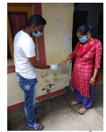
માણાવદર તાલુકા હેલ્થ કચેરીના આરોગ્ય કર્મચારીઓ દ્વારા તાલુકા ના કોરોના પોઝિટિવ દર્દીઓની ધરે મુલાકાત લઈને તેમને હોમ આઈસોલેશન કરવામાં આવ્યા