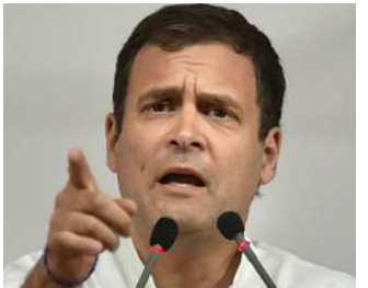
જો આપણે કોરોના વાયરસના કેસોની વાત કરીએ તો દેશમાં સાત લાખ કોરોના વાયરસના કેસ છે અને ૧૯ હજારથી વધુ લોકોનાં મોત નીપજ્યાં છે. છેલ્લા કેટલાક દિવસોથી દરરોજ આશરે ૨૫ હજાર કેસ આવી રહ્યા છે એટલે કે દર ચાર દિવસે એક લાખ જેટલા કેસ આવે છે. ભારત હવે વિશ્વના કુલ કેસોની દ્રષ્ટિએ ત્રીજા સ્થાને આવી ગયું છે, ફક્ત અમેરિકા અને બ્રાઝિલ ભારતથી આગળ છે.

ન્યુ દિલ્હી, તા. ૬ રાહુલ ગાંધીએ પોતાના વીડિયોના કેપ્શનમાં ત્રણ મુદ્દાઓનો ઉલ્લેખ કર્યો છે જેમાં કોવિડ-૧૯, ડિમોનેટાઈઝેશન અને જીએસટી છે. રાહુલે કહ્યું કે તેમને હાર્વર્ડની બિઝનેસ સ્કૂલમાં નિષ્ફળતા તરીકે ભણાવવામાં આવશે. કોંગ્રેસ નેતાએ આ સાથે વડા પ્રધાન નરેન્દ્ર મોદીનો એક વીડિયો શેર કર્યો. જેમાં તેમણે દેશને સંબોધન કરતાં કહ્યું હતું કે કોરોના વાયરસ સામેનો યુદ્ધ ૨૧