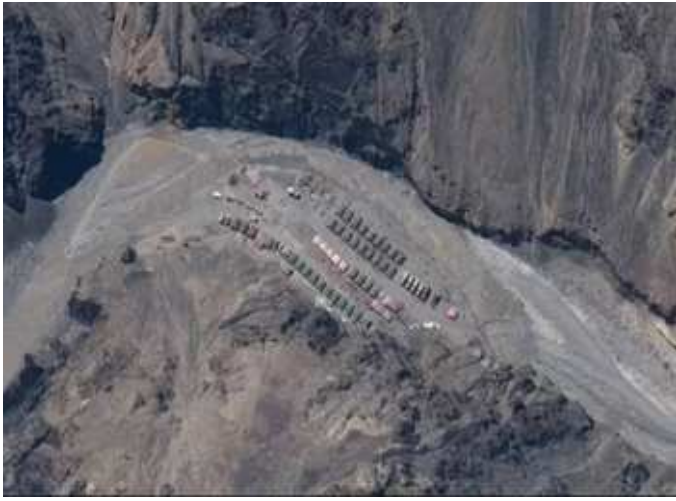
સરહદેથી નામ લીધા વગર ચીનને પડકાર આપ્યો હતો કે તેણે વિસ્તારવાદી નીતિ છોડી દેવી જોઈએ.

ભારત-ચીન વચ્ચે ૧૫ જૂનની હિંસક ઝપાઝપી પછી બંને દેશો વચ્ચે થયેલી ડિપ્લોમેટિક અને આર્મી લેવલની બેઠકોના છેલ્લા ૪૮ કલાકોથી ચાલતા સતત પ્રયત્નો અને વડાપ્રધાન નરેન્દ્ર મોદીની લેહ મુલાકાતે રંગ લાવ્યાં હોય તેમ ચીનના સૈનિકો લાઈન ઓફ એક્ટ્યુઅલ કંટ્રોલ પર તેમની તરફ ૧.૫ કિમી પાછળ ખસી ગયા છે. એક રીતે જોતા ચીનની પીછેહઠ થઈ છે અને આ તણાવમાં ભારતનો હાથ ઉપર રહ્યો છે. જે ભારતની જીત સમાન માનવામાં આવી રહ્યું છે. વડાપ્રધાન નરેન્દ્ર મોદીની શુક્રવારની અચાનકલેહ-લદાખ મુલાકાત પછી બંને દેશો વચ્ચે તણાવ ઓછો કરવાના પ્રયાસો હાથ ધરાયા હતા. મોદીએ લદાખ