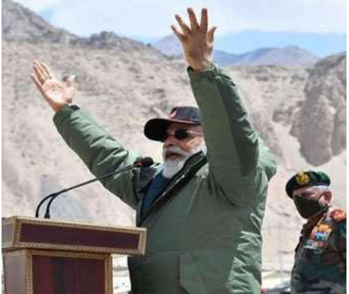
ઘટનાસ્થળની મુલાકાત કરવા માટે આ લેહ પહોંચ્યા હતા. અહીં સેનાના વરિષ્ઠ અધિકારીઓએ તેમને તમામ પરિસ્થિતિથી અવગત કરાવ્યા હતા. વડાપ્રધાને લેહ ખાતે ભારતીય સેના, વાયુસેના અને આઈટીબીપીના જવાનોની સાથે મુલાકાત કરી હતી. મોદીએ આજે નિમુમાં ૧૧ હજાર ફૂટ ઉંચી ફોરવર્ડ લોકેશન પર આર્મી, એરફોર્સ અને આઈટીબીપીના જવાનો સાથે વાત કરી હતી. નિમુ ચીન સરહદથી માત્ર ૨૫૦ કિમી જ દૂર છે. તેમની સાથે ચીફ ઓફ ડિફેન્સ સ્ટાફ જનરલ બિપિન રાવત અને આર્મી ચીફ એમએજ નરવણે પણ છે. મોદીએ જવાનોની વાતચીતનો ફોટો ઈન્સ્ટાગ્રામ પર શેર કર્યો છે. તેમણે ગલવાન ઝપાડપીમાં ધાયલ થયેલા સૈનિકો સાથે પણ આજે મુલાકાત કરી છે.

માતાઓ જેમણે સૈનિકોને જન્મ આપ્યો છે.” ત્યારબાદ પીએમ મોદીએ કહ્યું કે, “જવાનોનાં સુરક્ષા ઉપકરણો અને હથિયારોની દરેક સંભવ મદદ કરવાનો પ્રયત્ન સરકાર કરી રહી છે.” પીએમ મોદીએ કહ્યું કે, “અમે સશસ્ત્રદળોની જરૂરિયાતો પર સંપૂર્ણ ધ્યાન આપી રહ્યા છીએ.” વડાપ્રધાન મોદીએ જવાનોનો ઉત્સાહ વધારતા કહ્યું કે, તેમની ભુજાઓ પથ્થરો જેવી છે. ત્યારબાદ પીએમ મોદી બોલ્યા કે, દુશ્મનોએ જવાનોનો જોશ અને ગુસ્સો જોઈ લીધો છે. જવાનોની પ્રશંસામાં પીએમ મોદીએ કહ્યું, “તમે જે વીરતા હાલમાં જ બતાવી છે તેનાથી વિશ્વમાં ભારતની તાકાતને લઈને એક સંદેશ ગયો છે. તમારા (જવાનો) અને તમારા મજબૂત સંકલ્પનાં કારણથી આત્મનિર્ભર ભારત બનવાનું આપણો સંકલ્પ મજબૂત થયો છે.” પીએમ મોદીએ કહ્યું કે, “તમારી ઈચ્છાશક્તિ હિમાલય જેવી મજબૂત અને અટલ છે, દેશને તમારા પર ગર્વ છે. તમારા સન્માન, તમારા પરિવારના સન્માન અને ભારત માતાની સુરક્ષાને દેશ સર્વોચ્ચ પ્રાથમિકતા આપે છે. સેના માટે આધુનિક હથિયાર હોય અથવા તમારી ચીજ વસ્તુ અમે આની પર ધ્યાન આપીએ છીએ. બોર્ડર ઈન્ફાસ્ટ્રક્ચર પર ખર્ચે લગભગ ૩ ગણો કરી દેવાયો છે. આનાથી બોર્ડર એરિયા ડેવલપમેન્ટ અને સીમા પર રસ્તા-પુલ બનાવવાનું કામ પણ ઝડપથી થઈ રહ્યું છે. અત્યાર સુધી તમારા સુધી સામાન પણ ઓછામાં ઓછા સમયમાં પહોંચે છે. સેનામાં સમન્વય માટે ચીફ ઓફ ડિફેન્સની રચનાની વાત હોય અથવા વોર મેમોરિયલ અથવા તો વન-પેશન વન રેકની વાત હોય. અમે સેનાઓ અને સૈનિકોને મજબૂત કરી રહ્યા છીએ. ૧૫ જૂનની રાત્રે ગલવાન ખીણ વિસ્તારમાં થયેલી આ હિંસક અથડામણમાં ૨૦ ભારતીય જવાનોએ પોતાનો જીવ ગુમાવ્યો હતો. વડાપ્રધાન મોદી