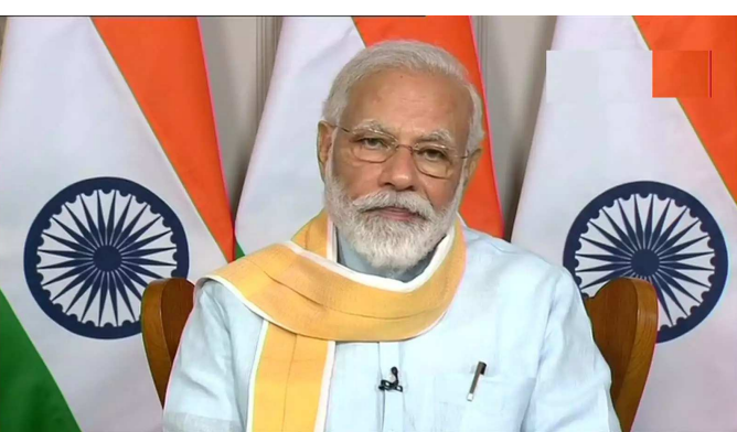
ન્યુ દિલ્હી, તા. ૨૭ જુલાઈ. ડો. જોસફ માર થોમા મેટ્રોપોલિટનની ૯૦ મી જન્મ

જયંતિ સમારોહમાં વીડિયો કોન્ફરન્સિંગ દ્વારા ઉદ્ઘાટન ભાષણ આપ્યું. ભારત અને વિદેશથી માર થોમા ચર્ચના કેટલાક અનુયાયીઓએ કાર્યક્રમમાં ભાગ લીધો. પોતાના સંબોધનમાં તેમણે કહ્યું કે દુનિયા અત્યારે વૈશ્વિક મહામારી કોરોના વાઈરસ વિરુદ્ધ એક મજબૂત લડત લડી રહી છે. કોવિડ-૧૯ માં એક શારીરિક બીમારી નથી કે જે લોકોના જીવન માટે જોખમ છે