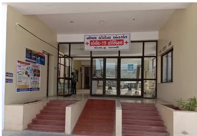
શહેરની ઉમિયા ટાઉન શીપમાં રહેતા આધેડ કોરોનામાં સપડાતા લોકોમાં ફફડાટ ફેલાયો છે જિલ્લામાં સૌથી વધુ કપરી સ્થિતી મોડાસા શહેરની બની છે

અરવલ્લી બ્યુરો મોડાસા સમગ્ર દેશમાં કોરોના વાયરસથી સંક્રમિત લોકોની સંખ્યા ત્રણ લાખને પાર કરી ગઈ છે. અત્યાર સુધી સાડા છ લાખ લોકોનાં મોત થયા છે. કોરોના વાયરસનો ચેપ દેશમાં ઝડપથી ફેલાઈ રહ્યો છે ત્યારે મોડાસા શહેર સહીત અરવલ્લી જિલ્લામાં કોરોનાની સ્થિતિ બેકાબુ બની રહી છે જિલ્લામાં છેલ્લા ૨૪ કલાકમાં ૫ લોકોનો કોરોના પોઝિટીવ આવતાં જિલ્લામાં કોરોના સંક્રમિત દર્દીઓની સંખ્યા ૧૪૭ પર પહોંચી ગઈ છે મોડાસા શહેરમાં સતત કોરોના દર્દીઓની સંખ્યા વધવાની સાથે લોકોને કોરોના ભરખી