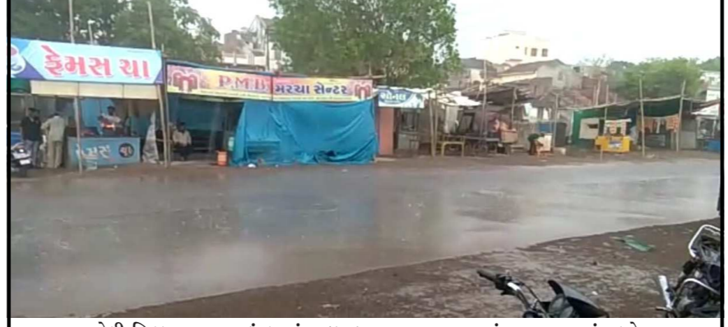
અમરેલી જિલ્લા ના સાવરકુંડલામાં વાદળ છવાયા વાતાવરણ માં વાતાવરણ માં પલ્ટો થતા પવન સાથે વરસાદ ખાબક્યો હતો થોડી વાર મેઘરાજા એ વિરામ લેવા ફરીવાર મેઘરાજાએ સાવરકુંડલા મહેરબાન થતા કાળ જાળ ગરમી માં ઠંડી નો માહોલ થતા લોકો માં રાહત જોવા મળી હતી આ તકે વરસાદ માં રોડ પર પાણી ફરી વળ્યાં હતા અને વિજળી પણ ગુલ થઈ . અહેવાલ ;યોગેશ ઉનડકટ સાવરકુંડલા, અમરેલી

ગામની સમસ્યા મિડિયામાં પ્રસિદ્ધિ કરતા દાંતા તાલુકાના વસી ગ્રુપ ગ્રામ સચિવાલયના સરપંચ મિડિયા ને સફાઈનું કામ કરવા કહેતા જગતના મિડિયામાં રોષ ફેલાયો દાંતા તાલુકાના વસી ગ્રુપ ગ્રામ સચિવાલયના સરપંચ નો ઓડીયો વાયરલ પત્રકારો ને રજા સિવાય ગામમાં ના આવવું એવો ઓડીયો થયો વાયરલ થું સાબિત કરવા માગી રહ્યા છે સરપંચ પત્રકારો સાથે કેમ કરી રહ્યા છે ગેર ભર્યું વર્તન કરી શુ સાબિત કરવા માંગે છે સરપંચ વસી ગ્રુપ ગ્રામ સચિવાલયના