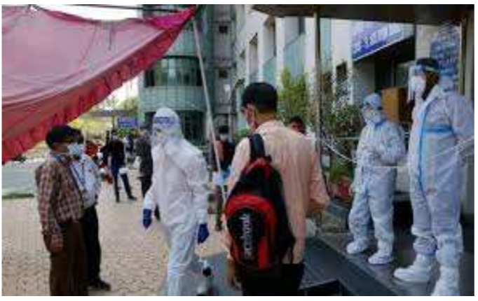
મુંબઈમાંથી બહાર આવી રહ્યાં છે. મહારાષ્ટ્રમાં અત્યાર સુધીમાં કોરોના વાયરસના કુલ ૭૪૮૬૦ કેસ નોંધાયા છે જ્યારે ૨૫૮૭ લોકોએ પોતાના જીવ ગુમાવ્યા છે. મહારાષ્ટ્ર બાદ તમિલનાડુમાં કોરોના વાયરસના સૌથી વધારે કેસ નોંધાયા છે. તમિલનાડુમાં અત્યાર સુધીમાં કુલ ૨૫૮૭૨ કેસ નોંધાઈ ચૂક્યા છે જેમાંથી ૨૦૮ લોકો કાળનો કોળિયો બની ગયા છે. ત્યારબાદ દિલ્હીમાં ૨૩૬૪૫ કેસ નોંધાયા છે જ્યારે ૬૦૬ લોકોએ જીવ ગુમાવ્યા છે. ગુજરાતમાં ૧૮૧૧૭ લોકો સંક્રમણમાં આવ્યા છે ૧૧૨૨ લોકોના મોત થયા છે. રાજસ્થાનમાં અન્ય બિમારીઓથી પીડિત ૧૭૬ લોકોએ કોરોનાને હરાવ્યો છે. બીજા બાજુ ઈન્ડિયન કાઉન્સિલ ઓફ મેડિકલ રિસર્ચે જણાવ્યું કે, અત્યાર સુધી ૪૨ લાખ ૪૨ હજાર ૭૧૮ સેમ્પલની તપાસ કરાઈ છે. સાથે જ છેલ્લા ૨૪ કલાકમાં એક લાખ ૩૮ હજાર ૪૮૫

બનાવવો જોઈએ, જેને હરિયાણા, યુપી અને દિલ્હી ત્રણેય રાજ્યોમાં માન્યતા હોય. કોર્ટે કહ્યું કે ત્રણેય રાજ્યોના પ્રતિનિધિ/અધિકારીઓએ બેઠક કરવી જોઈએ અને આ મુદ્દે ઝડપથી સમાધાન પણ કરવું જોઈએ. વિશ્વ ફલક પર નજર નાંખીએ તો, દુનિયાભરમાં કોરોના વાયરસના અત્યાર સુધીમાં ૬૪૩૦૮૦૦ કેસ નોંધાઈ ચૂક્યા છે. જેમાંથી ૩૮૫૮૩૪ લોકોના મોત નિપજ્યા છે જ્યારે ૨૮૦૫૦૧૮ લોકો સ્વસ્થ થવામાં સફળ થયા છે. સમગ્ર દુનિયામાં અત્યારે ૩૨૩૮૮૪૮ કેસ એક્ટિવ છે. ભારત દેશમાં સતત વધી રહેલા કેસના કારણે દુનિયામાં સૌથી વધારે કેસ ધરાવતા દેશોની યાદીમાં સાતમાં ક્રમાંક પર પહોંચી ગયો છે. જ્યારે સ્વસ્થ થયેલા દર્દીઓની યાદીમાં ભારત અમેરિકા, બ્રાઝીલ, રશિયા, જર્મની, ઈટાલી, સ્પેન, ઈરાન, તુર્કી બાદ નવમાં ક્રમ પર છે.