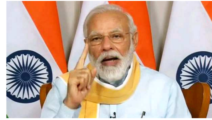
નવી દિલ્હી, તા.૧ પણ આપણા પોલીસકર્મી, મેડિકલ ટીમ એટલે કે આપણા કોરોના વોરિયર્સ જોવા મળે છે. એ લોકો આજે સોમવારે ક્ષણટકના રાજ્ય વોરિયર્સ જોવા મળે છે. આ લડાઈ જોવા ન સાવચેતના સિલ્વર જ્યુબલી મળતા દુશ્મનો-અદ્રશ્ય અને મજબૂતાઈથી જૂઠી રહેલા યોદ્ધાઓ વચ્ચે છે. જેમાં આપણા ઉદ્વાટન કર્યું હતું. તેમણે આ પ્રસંગે કહ્યું કે, વાઈરસ જોવા મળતો નથી, મેડિકલ વર્કસની જીત નક્કી છે. હું

સ્પષ્ટ કહેવા માગ્યું છે કે કોરોનાની લડાઈમાં કામ કરી રહેલા ફ્રન્ટલાઈન વર્કર્સ સાથે અભદ્ર વર્તન અને હિંસા ક્યારે ચલાવી લેવાશે નહીં. મોદીએ એવું પણ કહ્યું કે, ભારતમાં દુનિયાની સૌથી મોટી હેલ્થકેર સ્કીમ આયુષ્માન ભારત ચાલી રહી છે. બે વર્ષથી ઓછા સમયમાં આનાથી એક કરોડ લોકોને ફાયદો મળ્યો છે. આ યોજનાથી સૌથી વધારે ફાયદો મહિલાઓ અને ગ્રામીણ લોકોને થયો છે. ૨૨ એઈમ્સ ઝડપથી બનાવવા માટે અમે તનતોડ મહેનત કરી રહ્યા છીએ. છેલ્લા ૫ વર્ષમાં એમબીબીએસની ૩૦ હજાર અને પીજીની ૧૫ હજાર સીટ વધારવામાં સફળતા મળી છે.