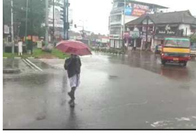
વરસાદ થયો છે. કેરળમાં ભારે વરસાદ સાથે ભારતીય હવામાન વિભાગને રાજ્યનાં ૯ જિલ્લાઓને યલો એલર્ટ જાહેર કરી દીધેલ છે. હવામાન વિભાગે કરેલનાં તિરૂવનંતપુરમ, કોલ્લમ, પકાનમથિટ્ટા, અલાપુઝ્ઝા, કોટ્ટાયામ, એનકુલમ, ઈડુક્કી, મલપ્પુરમ અને કન્નૂર જિલ્લાઓમાં યલો એલર્ટ જાહેર કરી દીધેલ છે.