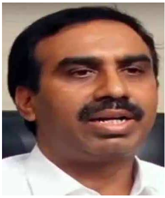
ઔદ્યોગિક એકમોમાં ૭૫૦૦ મેગાવોટ વિજળીનો વપરાશ થયો છે. રાજ્યમાં મોટા પાયે