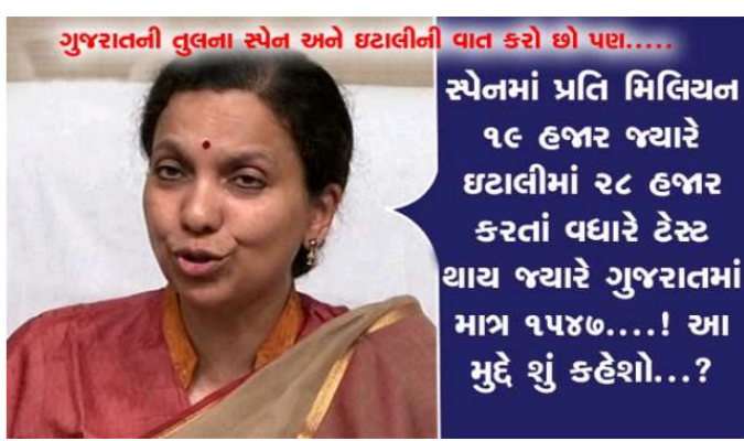
ગુજરાતની તુલના સ્પેન અને ઈટાલીની વાત કરો છો પણ.... સ્પેનમાં પ્રતિ મિલિયન ૧૯ હજાર જ્યારે ઈટાલીમાં ૨૮ હજાર કરતાં વધારે ટેસ્ટ થાય જ્યારે ગુજરાતમાં માત્ર ૧૫૪૭....! આ મુદ્દે શું કહેશે...?

પછી તેમની સાથે તુલના કરી રીતે થઈ શકે? સચિવના મનપસંદ આ બે દેશોમાં કેસો વધારે છે તેનું મુખ્ય કારણ એ છે કે ત્યાં ટેસ્ટીંગનું પ્રમાણ વધારે છે. જ્યારે ગુજરાતમાં ૩ હજાર ટેસ્ટીંગ રોજ રોજ થયા બાદ તેમાં ઘટાડો કરાયો અથવા તો આંકડા આપવામાં છબરડા જોવા મળ્યા છે. ટેસ્ટીંગ વધારે થાય તો પોઝીટીવ કેસો વધારે થાય. પણ જો ટેસ્ટીંગ ઓછા થાય તો દેખીતી રીતે જ કેસો પણ ઓછા બહાર આવે. આ રોગ કોઈ એવો તો છે નહીં કે શરીર પર તેના બાહ્ય લક્ષણો મળે અને તરત જ ઓળખાઈ જાય કે હાં, આ કોરોનાનો દર્દી છે. લક્ષણો માટે ટેસ્ટીંગ અનિવાર્ય અને ટેસ્ટીંગમાં ગુજરાત સ્પેન અને ઈટાલી કરતાં ૮૦ ટકા પાછળ છે તો સરકાર અને સચિવ તેની સાથે ગુજરાતની સરખામણી કરી રીતે કરી શકે? શું સચિવ રવિ સરકારને ગેરમાર્ગે દોરી રહ્યાં છે પરંતુ સરકારના કહેવાથી