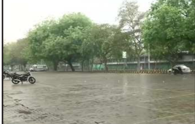
કોરોના વાયરસનો ફફડાટ અને લોકડાઉન વચ્ચે દિલ્હીવાસીઓના દિવસની શરૂઆત વરસાદ સાથે થઈ હતી. રાજધાની દિલ્હી સહિત કેટલાક વિસ્તારોમાં સવારે વરસાદી ઝાપટુ પડ્યું હતું. વરસાદના કારણે દિલ્હીમાં વાતાવરણ ખુશનુમા જવું મળ્યું છે. પરંતુ કોરોનાના વધતા કેસ વચ્ચે આ પ્રકારના વાતાવરણથી કેસ વધે તેવી પણ ચિંતા જોવા મળી હતી. દિલ્હીમાં વાતાવરણ ૪૦ ડિગ્રીની નીચે નોંધાયું છે, ત્યારે હવામાન વિભાગે વરસાદની આગાહી કરી હતી.

ગાંધીનગર,તા.૨૬ રાજ્યમાં એક તરફ કોરોનાનો કહેર છે તો બીજી તરફ ગરમીનો કહેર છે. આવી પરિસ્થિતિમાં હવામાન વિભાગે આગામી ૨૮ અને ૨૯ એપ્રિલ બે દિવસ દક્ષિણ ગુજરાતમાં વલસાડ, બાદ અરવલ્લી જિલ્લા વહીવટી તંત્રએ શ્રમિકોને વતન જવા માટે એસડી બસોની વ્યવસ્થા કરવાની તજવીજ હાથ ધરી છે. ત્યારે અરવલ્લી જિલ્લામાં રખાયેલ ૮૦૦ જેટલા શ્રમિકોને વતન તરફ મોકલવા માટે વ્યવસ્થા હાથ ધરી છે. મહવનું