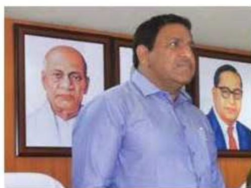
લોકો રોડ રસ્તા પર અને ઘરની બહાર ન નીકળે એટલે પોતે તહેકારી પણ રાખી રહ્યાં છે ત્યારે આ તહેકારીના ભાગરૂપે એક ગાંધીનગરમાં કલંકિત ઘટના બનતા અટકી હોય તો તેનો ક્રેધ સંકટમોચન બનેલા ડેપ્યુટી મેયર નાઝાભાઈ પોતેને જાય છે.