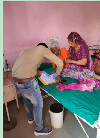
સલામત અને સુરક્ષિત રાખવા હાલમાં સમાજ સુરક્ષા વિભાગને ,આ બાળકોને તેમના પાલકો અને વાલીઓના હવાલે મૂકવા સૂચના આપી છે અને વિભાગ દ્વારા તેની કામગીરી હાથ ધરવામાં આવી છે.આ પાલકો અને વાલીઓ આ