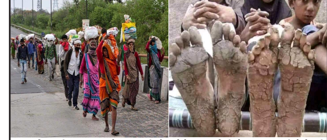
પરિવાર ની જીવનરક્ષા માટે કમાવા નીકળેલ લોકો ૧૦૦૦ કિમી જેટલું અંતર ચાલી ને પેટ ની ભૂખ મિટાવવા વતન પાછા ફર્યા.ગરીબ લોકો ની વેદના સમજે તે જ રાજનેતા અને રાજા...બાકી રાવણ રાજ...બાકી બધા શેતાન..

આયુર્વેદિક ઉકાળા પેકેટસ અને હોમિયોપેથિક મેડીસીનનું વિતરણ કરવામાં આવી રહ્યું છે. જેમાં અરવલ્લી જિલ્લાના પ હોમિયોપેથિક, ૧૯ આયુર્વેદિક દવાખાનાઓ મારફતે અત્યાર સુધી ૧૭૧ ગામોને આવરી લેવામાં આવ્યા છે. અરવલ્લી જિલ્લામાં લોકડાઉનનો અમલ શરુ થયા બાદ સોશિયલ ટિસ્ટનસીંગ જાળવી ૭૨,૧૦૬ લોકોને આયુર્વેદ ઉકાળાના ડોઝ અને ૪૧,૭૧૨ નાગરિકોને હોમિયોપેથીક દવાના ડોઝનું જિલ્લાના વિવિધ સ્થળોથી વિતરણ કરવામાં આવ્યું છે. જ્યારે ૫૪,૫૬૩ લોકોને ઉકાળા પેકેટસનું વિતરણ કરવામાં આવ્યું છે.