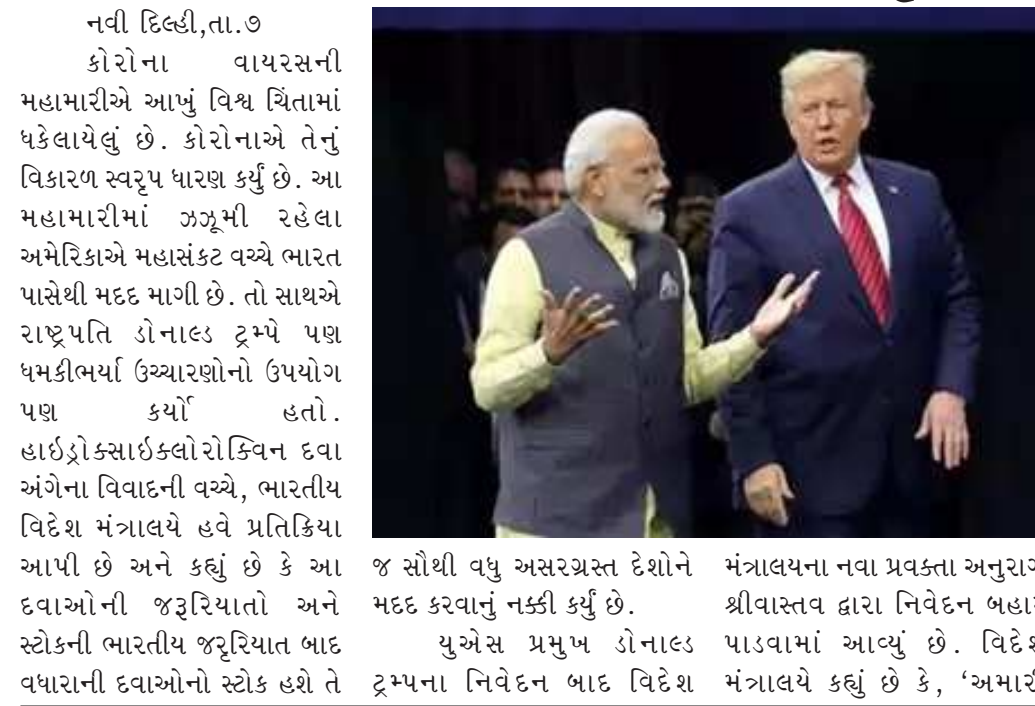
જ સૌથી વધુ અસરગ્રસ્ત દેશોને મદદ કરવાનું નક્કી કર્યું છે. યુએસ પ્રમુખ ડોનાલ્ડ ટ્રમ્પના નિવેદન બાદ વિદેશ