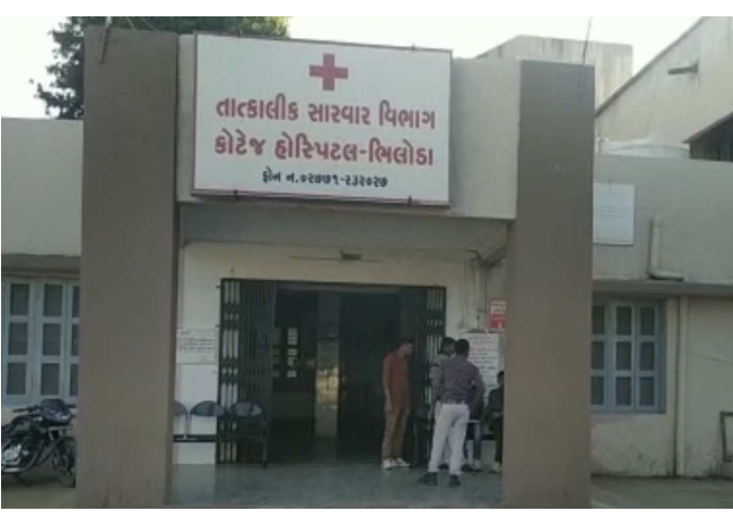
હેઠળ રાખી બાળકના સેમ્પલ લીધા હતા બાળકનો રિપોર્ટ નેગેટિવ આવતા તંત્રએ હાસકારો અનુભવ્યો હતો કોરોનાના લક્ષણો શંકાસ્પદ જણાતાં સાત વર્ષના બાળકને મોડાસાની સાર્વજનિક હોસ્પિટલમાં આઈસોલેશન વોર્ડમાં ઓબ્ઝર્વેશન માટે રાખવામાં આઈસોલેશન વોર્ડમાં ઓબ્ઝર્વેશન

અરવલ્લી બ્યુરો મોડાસા સમગ્ર ભારત સાહિર વિશ્વ કોરોના વાયરસના ભરડામાં સપડાયો છે, ત્યારે ગુજરાત પણ એમાંથી બાકાત નથી, ૧૪૫ કોરોના પોઝીટિવ ના દર્દી હાલ સારવાર હેઠળ છે, અને ૧૨ દર્દી ના મોત નિપજ્યા છે, અરવલ્લી જિલ્લામાં પણ ૨૨ જેટલા શંકાસ્પદ કેસ જણાતાં તમામ દર્દીઓના સેમ્પલ લેબોરેટરી પરીક્ષણ માટે મોકલાયા હતા. જેમાં તમામ દર્દીઓના રિપોર્ટ નેગેટિવ આવતા અરવલ્લી જિલ્લા વહીવટીતંત્ર તેમજ આરોગ્યતંત્રએ હાસકારો અનુભવ્યો હતો. ત્યારે વધુ એક સાત વર્ષના બાળકને શરદી ખાંસી સહિતના શંકાસ્પદ લક્ષણો જણાતાં સારવાર માટે મિલોડાની કોટેજ હોસ્પિટલમાં ભરતી કરાયો હતો. સાર્વજનિક હોસ્પિટલમાં આઈસોલેશન વોર્ડમાં ઓબ્ઝર્વેશન માટે રાખવામાં આઈસોલેશન વોર્ડમાં ઓબ્ઝર્વેશન