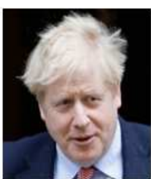
મંગળવારના સમાચાર મુજબ ત્યાંની કુલ વસ્તી 67,809,080 ના પ્રમાંણમાં લગભગ 5,373 લોકો મોતના ભોગ બન્યા છે.

શ્રી જોન્સન અને તેની કેબિનેટ ફક્ત 7 દિવસોમાં જ 4000 ખટલાવાળી કોસ્પિટલ - Excel Exhibition Centre in London's Docklands ઉભી કરી દીધી હતી. અને આટલી મોટી કોસ્પિટલો બીજા મોટા શહેરોમાં પણ શરૂ થી ગઈ છે. મોટા સુપર સ્ટોરો ના કારપાર્કમાં ટેસ્ટિંગ સેન્ટરો ઉભા કરી દીધા છે. બોરિસજી એ યુકે ના પંજાબી કુટુંબમાં જન્મેલા, શ્રી ઋષિ સુનદ ને ચાન્સેલર (નાણાપ્રધાન) તરીકે નીમ્યા હતા અને મોટી સહાયતા માટેના પૈસા અને વ્યવસ્થા ભાર પડી હતી. સરકારી કોસ્પિટલોના કોરોના દેવાં માંડ કરી અને મદદ માટે પૈસાની પોટલી ખોલી નાખી હતી.