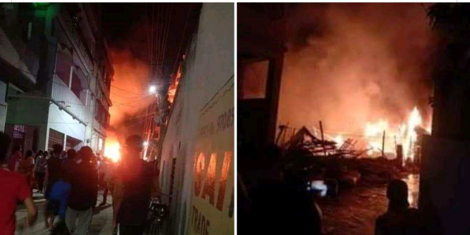
રહમાન આના શુરુ- #દિવા જલાતે જલાતે બિહાર પટના કે #રામકૃષ્ણ નગર મંત્રીને મયંકર #આગ લગા દી હૈ! #અંધેર નગરી ચોપટ રાજા

જગડાવાની સંવૈધાનિક ફરજોમાં અસફળ સરકાર મહામારીને અવસરમાં ફેરવવા મનોરંજક કાર્યક્રમો આપે તે દુઃખદ છે. સમયાનુસાર ટી.વી.ના માધ્યમથી આકાશવાણી કરતા વડાપ્રધાને જો સરકારની કરોના સામેની તૈયારીઓ વિશે હેયાધારણ આપી હોત તો મનોજ તિવારી અને નરેન્દ્રભાઈ મોદીમાં આપણે ફરક અનુભવી શક્યા હોત. પ્રજા એકજુટ છે માટે જ લોક ડાઉન મહદઅંશે સફળ છે હવે એકસંપ થઈ જવાબદારી સરકારે નીભાવવાની છે. લોકોએ તમે કહ્યું એટલે થાળી ને તાળી વગાડી, તમે કહ્યું તો દીવા કર્યા હવે લોકોને એ ભરોસો તો આપો કે તમે શું કરી રહ્યા છો ? બધું જનતાએ જ કરવાનું હોય તો મોદીજી તમે પણ રીન્કીયા કે પાપા જેવા ટીકટોક વીડીયો બનાવી મજા કરો. મોદીજી ભુલ્ય જાય છે કે તેઓ વડાપ્રધાન છે આધ્યાત્મિક ગુરુ નહીં. આશારામ અને શ્રી શ્રી જેવાઓની સોબતમાં તેઓ પણ ક્યારેક ધર્મગુરુની જેમ વર્તે છે. એ ઈશ્વરથી લઈને તમામ જગ્યાએથી માસ્ક, સેનેટરાઈઝર, વેન્ટિલેટર અને સ્ટાફની સુરક્ષાના અભાવની ફરિયાદ આવી રહી છે ત્યારે મોદીજી કહેવું જોઈએ કે તેમની સરકાર આ તમામ ક્ષેત્રે શું કરી રહી છે. ચિંતા ના કરશો સરકાર તમામ તૈયારીઓ પુર્ણ કરી રહી છે એનો વાસ્તવિક ચિતાર આપવો જોઈએ. તબીબો પર થતા હુમલા સામે આંખ લાલ કરવી જોઈએ. ભગવાને આંખ માત્ર બિચારી અને નબળી જનતા સામે જ લાલ કરવા નથી આપી. લોકોનો આત્મવિશ્વાસ ત્યારે જાગે જ્યારે તેઓ સરકારથી આશ્ચસ્ત થઈ ભયમુક્ત બને. દીવાઓ ગણીને પોતાના અંધ સમર્થકોની ગણતરી માંડવા જતાં કરોનાના કેસોની ગણતરી દીવસે ને દીવસે