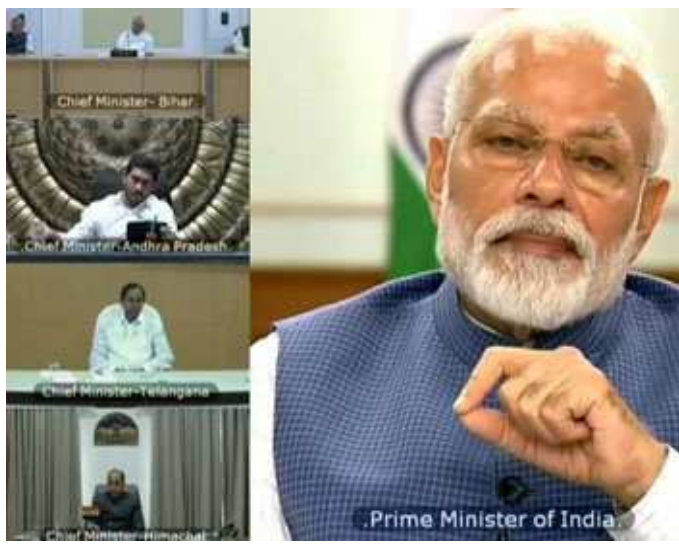
સામે લડાવા માટેની વિવિધ રાજ્યનીઓ પર પણ વાત કરી હતી આ દરમિયાન કેન્દ્ર સરકારે તમામ રાજ્યો અને કેન્દ્ર શાસિત પ્રદેશોને કોરોના સંબંધિત સમાચારોની પુષ્ટિ માટે પોર્ટલ

ન્યુ દિલ્હી, તા. ૨ ૧૩૦ કરોડની આબાદી વાળા વિશાળ ભારત દેશમાં કોરોના વાઈરસ સામે લડાઈમાં એક તરફ ૨૧ દિવસના લોકડાઉનનો કાર્યકાળ ચાલી રહ્યો છે ત્યારે લોકડાઉનના નવા દિવસે આજે ગુરુવારે વડાપ્રધાન નરેન્દ્ર મોદીએ વિડિયો કોન્ફરન્સના માધ્યમથી વિવિધ રાજ્યોના મુખ્યમંત્રીઓ સાથે બેઠક યોજીને રાજ્યોને ખાતરી આપી હતી કે કોરોના સામેની આ લડાઈ આપણે સૌ સાથે મળીને જીતીશું. સૌનો સહયોગ જરૂરી છે એમ કહીને તેમણે રાજ્યોને લોકડાઉનનો કડક અમલ કરવા જણાવ્યું હતું, આ બેઠક બાદ એક સીએમ દ્વારા કરાયેલા દ્વિવિધી એવા નિર્દેશો મળ્યા કે ૧૪ એપ્રિલ પછી પણ