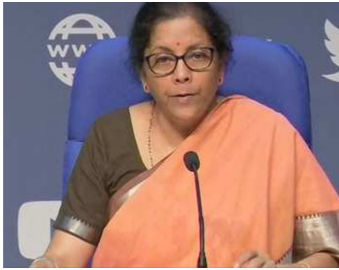
ભૂમિકાનું મહત્વ સમજતા સરકારે તેમને આગામી ત્રણ મહિના માટે ૫૦ લાખ રૂપિયાનું મેડિકલ

ન્યુ દિલ્હી, તા. ૨૬ નાણાં મંત્રી નિર્મલા સીતારમણે કોરોનાવાયરસ સામેની લડાઈમાં રાહત માટે ૧.૭૦ લાખ કરોડના રાહત પેકેજની જાહેરાત કરી છે. તેમણે કોરોના સામે લડાઈમાં મદદ કરી રહેલા સ્વાસ્થ્ય કર્મચારીઓનો આભાર વ્યક્ત કર્યો હતો. તેમના માટે ૫૦ લાખ રૂપિયાના મેડિકલ વીમાની જાહેરાત કરી છે. તેમાં આશા વર્કર, પેરામેડિકલ સ્ટાફ, ટેકનિકલ સ્ટાફ, ડોક્ટર સહિતના કર્મચારીઓનો સમાવેશ થાય છે. તેનાથી ૨૦ લાખ જેટલા કર્મચારીઓને લાભ મળશે. ૧. ગરીબોને મફત અનાજ