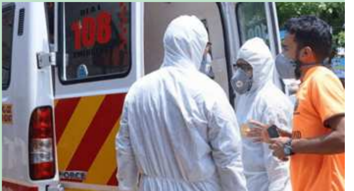
હતો. ડોક્ટરોએ જણાવ્યું હતું કે, શ્રીનગર શહેરની ચેસ્ટ ડિસીઝ હોસ્પિટલમાં સારવાર લઈ રહેલા કોરોનાવાયરસથી સંક્રમિત ૬૫ વર્ષીય વર્ષિય દર્દીનું મોત નીપજ્યું હતું. ડોક્ટરે કહ્યું, xતે વ્યક્તિ હાઈ બ્લડ પ્રેશર, ડાયાબિટીઝ અને મેદસ્વીપણથી પીડિત હતો, આજે (ગુરુવારે) વહેલી સવારે તેણે દમ તોડી દીધો. x દર્દી ધાર્મિક લોકો પણ સ્વસ્થ થયા છે. પીણામાં કોરોના વાયરસને લીધે પ્રથમ મૃત્યુનો કેસ નોંધાયો છે. કોવિડ-૧૯ થી સંક્રમિત એક દર્દીએ શ્રીનગરની એક હોસ્પિટલમાં સારવાર દરમિયાન દમ તોડી દીધો

ન્યુ દિલ્હી, તા. ૨૬ દેશમાં કોરોના વાઈરસનું સંક્રમણ ૨૬ રાજ્યો સુધી પહોંચી ગયું છે. સંક્રમિતોનો આંકડો ૬૫૨ થયો છે. ૧૬ દિવસમાં ૧૭ પોઝિટિવ દર્દીઓના મોત થયા છે. ગુરુવારે જમ્મુ-કાશ્મીરના શ્રીનગરમાં ૬૫ વર્ષીય દર્દીએ જીવ ગુમાવ્યો છે. મહારાષ્ટ્રના મુંબઈમાં ૬૫ વર્ષની એક મહિલાનું મોત થયું છે. ગુજરાતના ભાવનગરમાં પણ ૭૦ વર્ષના વૃદ્ધ અને રાજસ્થાનના ભીલવાડામાં પણ એક દર્દીએ જીવ ગુમાવ્યો છે. બુધવારે તમિલનાડુના મદુરાઈમાં, મધ્યપ્રદેશના ઉજ્જૈનમાં અને ગુજરાતના અમદાવાદમાં ત્રણ અને ગુજરાતના અમદાવાદમાં ત્રણ