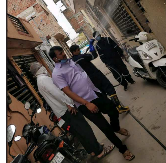
ગાંધીનગર મહાનગરપાલિકા ના સેક્ટર ૨૪ ના કોર્પોરેટર હજાર રહી તેમના મતવિસ્તાર ની અંદર સોસાયટીઓ માં દવા નો છંટકાવ કરવી સ્વચ્છતા કરાવી.

(૧) આ ફંડ ૧૯૯૭માં રચાયું હતું. તે એક ખાનગી ફંડ છે, સરકારી નહિ. તેનો વહીવટ મુખ્ય મંત્રીના અધ્યક્ષપદ હેઠળની પાંચ સભ્યોની સમિતિ કરે છે. મહેસૂલ ખાતું તેનું સંચાલન કરે છે. (૨) તેના નામને કારણે લોકોને તો એમ જ લાગે છે કે આ સરકારી ફંડ છે. પણ એ સરકારી ફંડ છે જ નહિ. (૩) આ ફંડના આવકજીવકના હિસાબો જાહેર કરવામાં આવતા નથી. વિધાનસભામાં પણ તે રજૂ થતા નથી. થોડાં વર્ષો અગાઉ માહિતી અધિકાર ધારા હેઠળ અરજી કરાઈ ત્યારે પણ તેની માહિતી આપવામાં આવી નહોતી અને એમ કહેવામાં આવ્યું હતું કે આ તો એક ખાનગી ફંડ છે. (૪) કેટલાક પૈસા ફંડમાં દાન પેટે આવ્યા અને તે ક્યારે, કોના