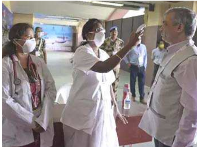
ચીન-ઈટાલી જેવી ભયાનક પરિસ્થિતિનો તબક્કો જેમાં મોતની સંખ્યા સૌથી વધારે મનાય છે. તેથી ભારત સરકારે વધુ મોત અટકાવવા તેને રાષ્ટ્રીય આપત્તિ કે મહામારી જાહેર કરીને સૌ કોઈને તેનાથી બચવાની અપીલ પણ કરી છે. સૂત્રોના જણાવ્યા પ્રમાણે ૩ એપ્રિલ સુધી ચાલનાર સત્ર ૧૮ માર્ચ સુધી સ્થગિત કરી દેવામાં આવે તેવી શક્યતા છે. ત્રણ સાંસદોએ પીએમને પત્ર લખીને સત્ર સમાપ્ત કરવાની માંગણી કરી છે. ભારતમાં કોરોનાના ૮૯ કેસ સામે આવ્યાં છે જેમાંથી બે લોકોના મોત નિપજ્યા છે. કેન્દ્રીય સ્વાસ્થ્ય

વાઈરસની વધતી અસરને ધ્યાનમાં રાખીને N-95 માસ્ક અને હેન્ડ સેનિટાઈઝરને જરૂરિયાતની વસ્તુની કેટેગરીમાં મૂકીને તેના કાળાબજાર કરનારાઓ સામે જેલની સજા સહિતના કડક પગલા ભરવાની જાહેરાત પણ કરી છે. બીજી તરફ આરોગ્ય નિષ્ણાતોના મતે કોરોના રોગચાળાની સ્થિતિને જોતાં બે મોત થતાં ભારત આ રોગના બીજા તબક્કામાં પહોંચી ગયું છે. અને તેને ત્રીજા તબક્કામાં જતાં રોકવા આગામી ૩૦ દિવસ ભારત માટે આ રોગને રોકવા માટે કટોકટીના સાબિત થશે. ત્રીજો તબક્કો એટલે