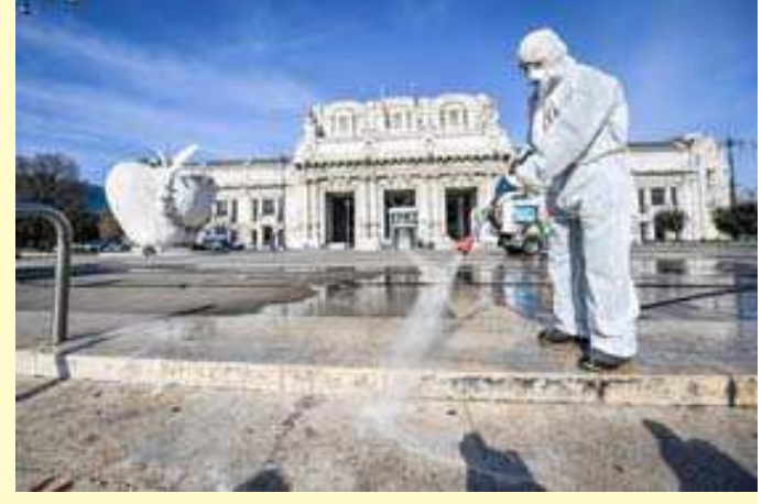
કલાકમાં કોરોના વાયરસની લપેટમાં આવેલા ૧૮ લોકોના મોત નિપજતા મૃત્યુઆંક વધીને ૭૯ સુધી પહોંચ ગયો છે. યુરોપમાં ઈટાલી ઉપરાંત સ્પેનમાં ૧૨૨ લોકોના મોત નિપજ્યા છે જ્યારે ૪૩૩૪ લોકો સંક્રમિત મળી આવ્યા છે. યુકેમાં કોરોનાના કારણે ૧૦ લોકોના મોત નિપજ્યા છે જ્યારે ૭૯૮ લોકો સંક્રમિત છે. આ ઉપરાંત જર્મનીમાં આઠ લોકોના મોત નિપજ્યા છે જ્યારે આશરે ૩૬૭૫ લોકો કોરોના

વેટિકન સિટી, તા. ૧૪ ઈટાલી માટે ગઈ કાલનો શુક્રવાર કોઈ 'બ્લેક ફ્રાઈડે'થી ઉતરતો નહતો. ફક્ત એક જ દિવસ એટલે કે ૨૪ કલાકની અંદર ઈટાલીમાં ૨૫૦ લોકોના મોત નિપજ્યા છે. આશ્ચર્ય પમાડનારી વાત તો એ છે કે શુક્રવારે કોરોના વાયરસના કારણે દુનિયાભરમાં સૌથી વધારે લોકોએ ઈટાલીમાં અંતિમ શ્વસ ભર્યા હતા. શુક્રવારના રોજ ચીન કરતા પણ વધારે મોત ઈટાલીમાં નિપજ્યા છે.