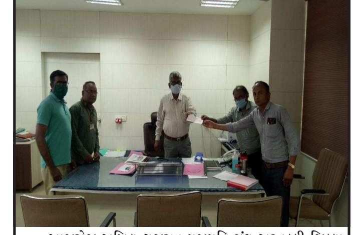
આજરોજ અખિલ ગુજરાત પ્રજાપતિ સંઘ અરવલ્લી જિલ્લા દ્વારા ફૂલ નહિ તો ફૂલ ની પાંખડી સ્વરૂપે ૧૧૦૦૦ રૂપિયાનું દાન મુખ્ય મંત્રી રાહત ફંડ covid,19 આપવામાં આવ્યું છે. નિવાસી કલેક્ટર વલવીને આ રકમનો ચેક અર્પણ કરવામાં આવ્યો હતો.

વલસાડ બ્યુરો : અજીત પટેલ નોવેલ કોરોના વાયરસને વેલ્ડ હેલ્થ ઓર્ગેનાઈઝેશન દ્વારા વૈશ્વિક મહામારી જાહેર કરવામાં આવી છે. આ વાયરસના સંક્રમણને અટકાવવા ભારત સરકાર દ્વારા તા. ૨૫/૩/૨૦૨૦થી ૨૧ દિવસ સુધી લોકડાઉનનો હુકમ કરાયો છે. લોકડાઉનના અમલ દરમિયાન કેટલીક વિશેષ જોગવાઈઓ કરવામાં આવી છે. તેમાં મકાન માલિકોએ ભાડૂઆત પાસેથી ભાડું વસુલ કરવાનું નથી. ઔદ્યોગિક એકમોના કેકેદારોએ પણ તેમના કામદારોને પગાર-ભોજન વગેરે આવશ્યક સેવાઓ પૂરી પાડવાની છે. તેમ છતાં કેટલાક વ્યક્તિઓ દ્વારા રાજ?યમાંથી અને બહારના