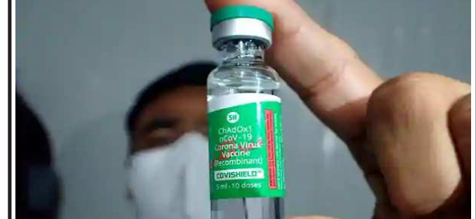
ન્યુ દિલ્હી, તા. ૨૨ કેન્દ્ર સરકારના જણાવ્યા અનુસાર, આ નિર્ણય રાષ્ટ્રીય કોરોના વેક્સિન કોવિશીલ્ડના પ્રથમ અને બીજા ડોઝ વચ્ચેનું અંતર વધારવાનો નિર્ણય લીધો છે. કેન્દ્રના નિર્દેશ અનુસાર, કોવિશીલ્ડના બંને ડોઝની વચ્ચે ઓછામાં ઓછું ૮ સપ્તાહ અઠવાડિયાનું અંતર હોવું જોઈએ. હાલમાં બંને ડોઝ વચ્ચેનું ૨૮ દિવસનું અંતર હતું. કેન્દ્રએ સ્પષ્ટતા કરી હતી કે આ નિર્ણય કોવેક્સિન પર લાગુ નહીં પડે. એવો દાવો કરવામાં આવ્યો છે કે જે વેક્સિનનો બીજો ડોઝ ૮ દિવસના અંતરે આપવામાં આવે તો એ વધુ અસરકારક સાબિત થશે.