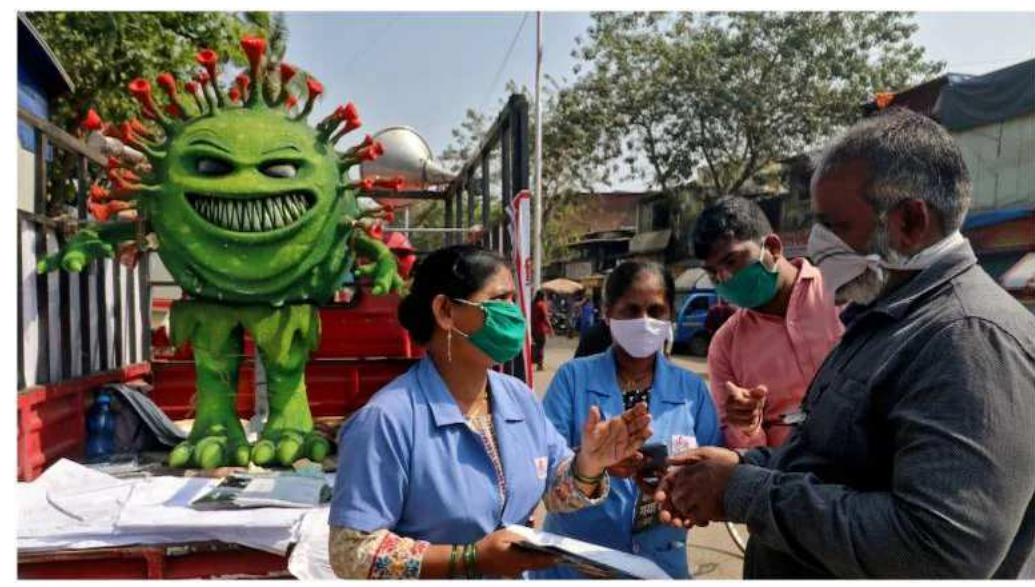
રાજ્યમાં રિક્વરી રેટ ૮૯.૩૨ ટકા છે. કુલ ૨૪,૭૯,૬૮૨ લોકો મહારાષ્ટ્રમાં કોરોના પોઝિટિવ છે. જ્યારે મુંબઈમાં પાછલા ૨૪ કલાકમાં કોરોનાના ૩૭૭૫ નવા કેસ મળ્યા. જ્યારે ૧૦ લોકોના મોત થઈ ગયા. ૧૬૪૭ રિક્વરી રેટ થયા. નાગપુરમાં ૩૬૧૪ નવા કેસ મળ્યા અને ૩૨ લોકોના મોત થઈ ગયા.

અને બે લોકોના મોત પણ થઈ ગયા. અહીં કુલ ૯,૭૦,૨૦૨ કેસ છે. અત્યાર સુધી ૧૨,૪૩૪ લોકોના જીવ કોરોનાના કારણે જઈ ચૂક્યો છે. રાજ્યમાં ૧૩,૪૯૩ એક્ટિવ કેસ છે. મહારાષ્ટ્રમાં મોટી સંખ્યામાં નવા કેસ જણાવી દઈએ કે, મહારાષ્ટ્રમાં રવિવારે ૩૦,૫૩૫ નવા કોરોના કેસ મળ્યા, જ્યારે ૯૯ લોકોના મોત થઈ ગયા. રાજ્યમાં ૯,૬૯,૯૬૭ લોકો હોમ ક્વોરન્ટાઈન છે અને ૯,૬૦૧ કોરોના સેન્ટરમાં ભરતી છે. મહારાષ્ટ્રમાં કુલ ૨,૧૦,૧૨૦ એક્ટિવ કેસ છે. આજે ૧૧,૩૧૨ દર્દી રિસ્ચાર્જ કરવામાં આવ્યા.