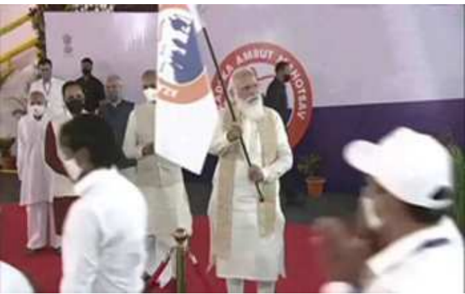
અમદાવાદ, તા. ૧૨ ઉજવણી શરૂ થઈ ગઈ ભારતની આઝાદીના ૭૫મા વર્ષે અમદાવાદના ગાંધી આશ્રમ પાતે આઝાદી કા અમૃત મહોત્સવ

મહોત્સવની ઉજવણીનો પ્રારંભ કરાવ્યો હતો. અમદાવાદ એરપોર્ટ પર ગુજરાતના પનોતા પુત્ર પીએમ નરેન્દ્ર મોદીનું ઉમળકાભેર સ્વાગત કરાયું હતું. જે બાદ પીએમ મોદીનો કાફલો એરપોર્ટથી સીધા ગાંધી આશ્રમ પહોંચ્યો હતો. ગાંધી આશ્રમ પહોંચીને પીએમ નરેન્દ્ર મોદીએ ગાંધીજીની પ્રતિમાને સુતરની આંટી પહેરાવી હતી. ત્યાર બાદ બોલિવૂડ સિંગર હરિહરન અને ઝુબિન નોટિયાલે પર્ફોર્મન્સ કર્યું હતું. જ્યારે પીએમ મોદીએ આઝાદીનો અમૃત મહોત્સવ વેબસાઈટ લોન્ચ કરી હતી.