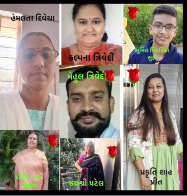
ન્યૂઝ ઓફ ગાંધીનગર દૈનિક આયોજિત સાહિત્ય સરિતા ગ્રુપ મા આજે સાત પદ્ય રચના પ્રસિદ્ધ કરવામાં આવી છે.

વિષય : સ્ત્રી . નારી ના નવલાં રૂપ ..સંપર્ક સૂત્રો.... www.janfariyadnews.com E m a i l : prdpraval42@gmail.com What's up calling No : 9824653073