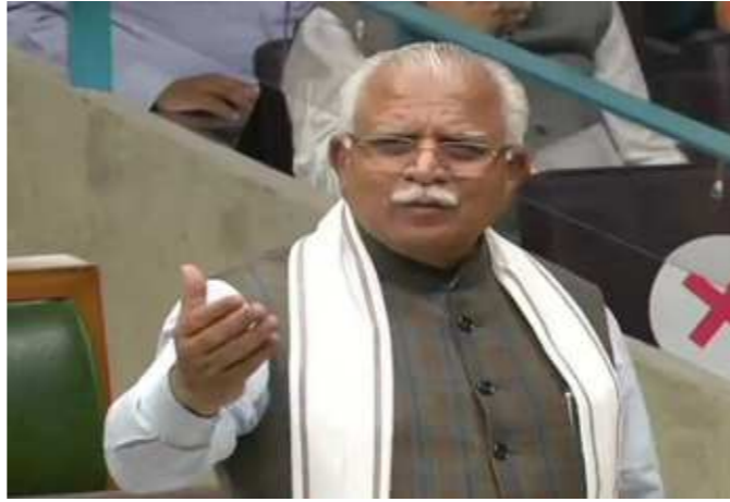
તેમણે કહ્યું કે, આ વખતે પણ પ્રત્યેકને વિશ્વાસ અપાવીએ છીએ કે જ્યારે મંડીમાં તમારું ફોર્મ ભૂપેન્દ્ર સિંહ હુડાએ બુધવારે

છે તો નહીં. તો હરિયાણાના નાયબ મુખ્યમંત્રી દુષ્યંત ચૌટાલાએ વિધાનસભામાં કહ્યું, ૧૦ વર્ષથી નારો લાગ્યો કે હુડા તેરે રાજમાં કિસાન ની જમીન ગઈ વ્યાજ મેં. છેલ્લા એક વર્ષમાં અમે ૩૦૦૦૦ હજાર કરોડ રૂપિયાના પાક એમએસપી પર ખરીદ્યા છે. તે માટે અમે ૧૮૦૦ ખરીદ કેન્દ્ર બનાવ્યા હતા.