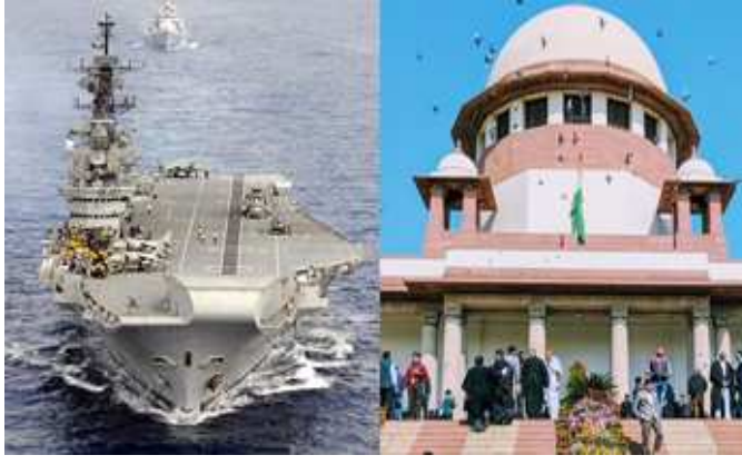
સુપ્રીમ કોર્ટમાં પહોંચ્યો છે. હાલ તો સુપ્રીમ કોર્ટે INS વિરાટને તોડવા પર રોક લગાવી છે. ભારતનું ઐતિહાસિક યુદ્ધ જહાજ જેણે ૫૬ વર્ષ સૌથી લાંબો સમય યુદ્ધ જહાજ તરીકે સેવા આપીને ગિનિસ બુક ઓફ વર્લ્ડ રેકોર્ડમાં સ્થાન મેળવ્યું હતું. તે

હાલ આ જહાજ ભાવનગરના અલંગમાં ભંગાણા માટે આવ્યું છે, જહાજને મ્યુઝિયમમાં રૂપાંતરિત કરવા અરજી કરાઈ, સુપ્રીમે ખરીદનારને પણ નોટિસ ફટકારી