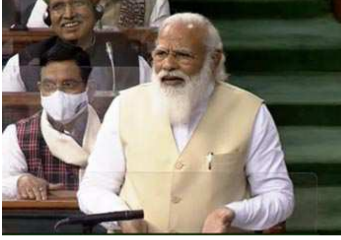
જતાં પીએમ મોદીએ કોંગ્રેસ પાર્ટી પર આકરા પ્રહારો કર્યા હતા. તેમણે એવા આરોપ પણ લગાવ્યા હતા કે કોંગ્રેસનું વલણ રાજ્યસભા અને લોકસભામાં અલગ-અલગ હોય છે. વડાપ્રધાને કોરોના મહામારીનો ઉલ્લેખ કરતા કહ્યું કે મહામારીને લીધે આવેલા સંકટ પર અનુમાન બાંધી લેવાયા હતા કે ભારત આ પડકારને કેવી રીતે ઝીલશે. પરંતુ ૧૩૦ કરોડ ભારતવાસીઓના અનુશાસન અને સમર્થનને દેશને બચાવી રાખ્યો. કોરોના મહામારી અને લોકડાઉન દરમિયાન દેશના અર્થતંત્રને જીવંત રાખવા માટે કેન્દ્ર સરકારે લીધેલા નિર્ણયો અને ઉઠાવેલા પગલાઓનું પણ પીએમ મોદીએ વર્ણન કર્યું હતું. મોદીએ કહ્યું, 'આ ગૃહમાં ૧૫ કલાકથી પણ વધુ ચર્ચા થઈ ચે. સભ્યોએ ચર્ચાને જીવંત બનાવી છે. તેમાં સભ્યોનો આભાર વ્યક્ત કરું છું. હું વિશેષ રૂપે મહિલા સાંસદોનો આભાર વ્યક્ત કરું છું. તેમની ભાગીદારી પણ વધુ હતી. રિસર્ચ કરીને મુદ્દાઓ રાખવાનો તેમનો પ્રયાસ હતો. પોતાની વાતોને તૈયાર કરીને તેઓએ આ ગૃહ અને ચર્ચાને સમૃદ્ધ કરી છે. તેથી તેમની તૈયારી, તેમના તર્ક અને તેમની દિર્ઘદ્રષ્ટી માટે હું વિશેષ રૂપે મહિલા સાંસદોનો આભાર વ્યક્ત કરું છું.'

ખેડૂતોએ આત્મનિર્ભર બનવું પડશે, કૃષિ કાયદો લાગુ થતા એપીએમસી અને એમએસપી યથાવત રહેશે, ખેડૂતોની શંકા દૂર કરાશે