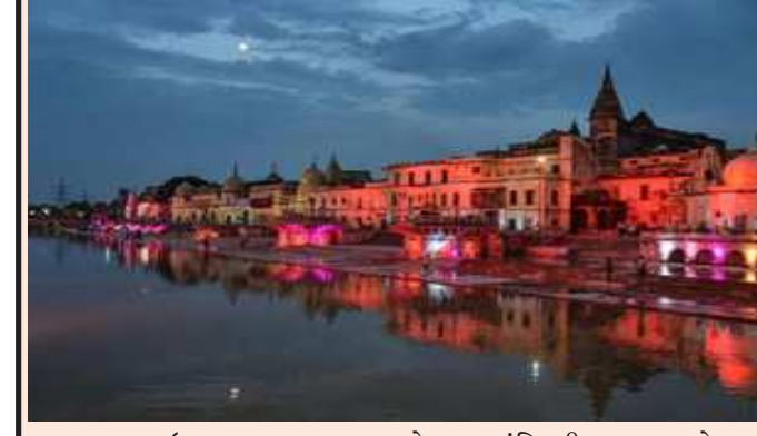
લખનઉ,તા.૧૦ રામનગરી અયોધ્યાની કાયકલ્પ કરવાની તૈયારીઓ શરૂ થઈ ગઈ છે. આ માટે, કેનેડાના એલઈએ એસોસિએટ્સને કન્સલ્ટેન્સી એજન્સી તરીકે નિયુક્ત કરવામાં આવી છે. આ કંપની અયોધ્યાનો પૂર્ણ વિકાસ, નગર આયોજન, પર્યટન, સિટી એરિયા પ્લાનિંગ બનાવશે. તેમાં સી.પી.કુકરેજ અને એલએન્ડટી ભાગીદારો હશે. કન્સલ્ટેન્સી કંપની બનવા માટે ૭ કંપનીઓએ બોલી લગાવી હતી.

લખનઉ,તા.૧૦ રામનગરી અયોધ્યાની કાયકલ્પ કરવાની તૈયારીઓ શરૂ થઈ ગઈ છે. આ માટે, કેનેડાના એલઈએ એસોસિએટ્સને કન્સલ્ટેન્સી એજન્સી તરીકે નિયુક્ત કરવામાં આવી છે. આ કંપની અયોધ્યાનો પૂર્ણ વિકાસ, નગર આયોજન, પર્યટન, સિટી એરિયા પ્લાનિંગ બનાવશે. તેમાં સી.પી.કુકરેજ અને એલએન્ડટી ભાગીદારો હશે. કન્સલ્ટેન્સી કંપની બનવા માટે ૭ કંપનીઓએ બોલી લગાવી હતી. રામ મંદિરની ભવ્યતા માટે ત્રણ કંપનીઓ સાથે હસ્તાક્ષર કરવામાં આવ્યા છે. અયોધ્યાના સ્માર્ટ સિટી એરિયા પ્લાનિંગ, રિવર એરિયા ડેવલપમેન્ટ, હેરિટેજ, ટૂરિઝમ અને શહેરી ઇન્ફ્રાસ્ટ્રક્ચર પ્લાનિંગ માટે આ કરાર કરવામાં આવ્યા છે. કેનેડિયન કંપની એલઈએ એસોસિએટ્સ સાઉથ એશિયા પ્રાઈવેટ લિમિટેડની પસંદગી અયોધ્યા ડેવલપમેન્ટ ઓથોરિટીએ કરી છે. મળતી માહિતી મુજબ ૨૬ ડિસેમ્બરે અયોધ્યા વિકાસ ઓથોરિટી દ્વારા રિક્વેસ્ટ ફોર પ્રોજેક્ટ પ્રકાશિત કરવામાં આવી હતી. રિક્વેસ્ટ ફોર પ્રોજેક્ટ હેઠળ જવાબદારી મળી જવાબદારી લેવાની હતી. અયોધ્યા વિકાસ ઓથોરિટી દ્વારા કુલ સાત ઓફરમાંથી છ ટેન્ડરોની પસંદગી સ્પર્ધા માટે કરવામાં આવી હતી. પ્રાપ્ત માહિતી અનુસાર, ટેન્ડર મૂલ્યાંકન સમિતિએ અયોધ્યામાં ભવ્ય વિઝન ડેવલપમેન્ટ તૈયાર કરવા માટે માટે છેલ્લી ત્રણ કંપની પર પસંદગી ઉતારી હતી. આ ત્રણ કંપનીઓમાં મેસર્સ એલઈએ એસોસિએટ્સ સાઉથ એશિયા પ્રાઈવેટ લિમિટેડ, મેસર્સ આઈપીઈ અને દેશના જાણીતી મેસર્સ ટાટા કન્સલ્ટિંગ એન્જિનિયરિંગ અંતિમ સ્પર્ધા માટે પસંદ કરવામાં આવી છે. પસંદ કરેલી કંપની એક સર્વે દ્વારા અયોધ્યા શહેરના વિસ્તૃત અભ્યાસ પર કામ કરશે. અયોધ્યાની ધાર્મિક પર્યટન ક્ષમતા અને રામ મંદિરના મહત્વને ધ્યાનમાં રાખીને, તે સર્વાંગી વિકાસ પર કામ કરશે. કંપની ઇન્ડિગ્રેટેડ ઇન્ફ્રાસ્ટ્રક્ચર યોજના અને નીતિ નિર્માણ પર પણ ધ્યાન આપશે.