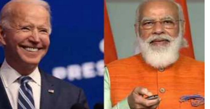
વોશિંગ્ટન, તા. ૩૦ બાઈડન સરકારે સત્રનાં સૂત્રો સંભાળ્યાના નવમા દિવસે અમેરિકાના વિદેશપ્રધાન એન્ટોની રી બ્લિનકેને ભારત અને પાકિસ્તાનના વિદેશપ્રધાનો સાથે વાત કરી હતી. બ્લિનકેને વિદેશપ્રધાન એસ. જયશંકર અને પાકિસ્તાની વિદેશપ્રધાન મોહમ્મદ ફરુશીની સાથે ટેલિફોન વાતચીત પછી એક નિવેદન જારી કર્યું હતું. જેમાં દક્ષિણ એશિયાને લઈને અમેરિકાની ભાવિ નીતિની ઝલક આપવામાં આવી છે.

વચ્ચે ટેલિફોનથી વાતચીત થઈ છે, જેમાં હિંદ પ્રશાંત ક્ષેત્રની ચર્ચા થઈ છે. આનો સાર બાઈડન અને વડા પ્રધાન મોદી વચ્ચે ટેલિફોન પર વાતચીત હશે. આ બંને નેતાઓની વચ્ચે એક-બે દિવસમાં ટેલિફોન પર વાતચીત થશે. બાઈડન સરકારે ક્વાડ વ્યવસ્થા જાપાન, ઓસ્ટ્રેલિયા, અમેરિકા, ભારતનું સંગઠન)નો ઉલ્લેખ કરીને સ્પષ્ટ કર્યું છે કે આ સંબંધો આગળ વધવાની નીતિ જારી રહેશે. ચીનને હિંદ પ્રશાંતથી વાંધો છે, કેમ કે આ ક્ષેત્રમાં ભારતને વધુ મહત્ત્વ અપાઈ રહ્યું છે. જોકે પાકિસ્તાન આતંકવાદ સામે પગલાં ભરશે અને અફઘાનિસ્તાનમાં સ્થાયી શાંતિ સ્થાપવામાં મદદ કરશે તો સામે સહયોગ પર રહેશે. છેલ્લા ત્રણ દિવસોમાં ભારત અને અમેરિકાના સંરક્ષણપ્રધાનો, આર્થિક સુરક્ષા સલાહકારો અને વિદેશ પ્રધાનોની