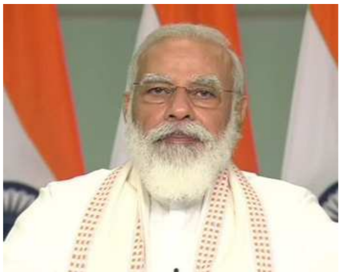
સર્વપક્ષીય બેઠકમાં પીએમ મોદીએ કહ્યું હતું કે, જે કૃષિ મંત્રી નરેન્દ્ર સિંહ તોમરે જે કહ્યું હતું

ન્યુ દિલ્હી, તા. ૩૦ ધીમે ધીમે વેગ પકડી રહેલા ખેડૂતો આંદોલનને લઈને કેન્દ્ર સરકારે નવા કૃષિ કાયદા વિરૂદ્ધ પ્રદર્શન કરી રહેલા ખેડૂતો સાથે વાતચીતની શક્તિઓ નકારી નથી અને તેને યથાવત રાખી છે. આજે સર્વપક્ષીય બેઠકમાં પ્રધાનમંત્રી નરેન્દ્ર મોદીએ કહ્યું છે કે, ખેડૂતોનો મુદ્દો વાતચીતથી જ હલ થશે. ખેડૂતોને આપવામાં આવેલો