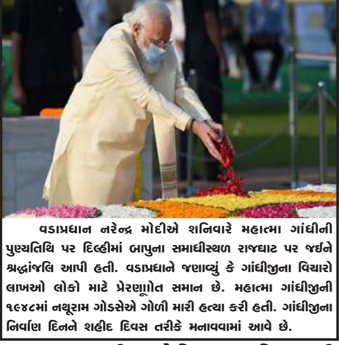
વડાપ્રધાન નરેન્દ્ર મોદીએ શનિવારે મહાત્મા ગાંધીની પુણ્યતિથિ પર દિલ્હીમાં બાપુના સમાધીસ્થળ રાજઘાટ પર જઈને શ્રદ્ધાંજલિ આપી હતી. વડાપ્રધાને જણાવ્યું કે ગાંધીજીના વિચારો લાખઓ લોકો માટે પ્રેરણાત્મક સમાન છે. મહાત્મા ગાંધીજીની ૧૯૪૮માં નજીરામ ગોડસેએ ગોળી મારી હત્યા કરી હતી. ગાંધીજીના નિવાસ દિનને શહીદ દિવસ તરીકે મનાવવામાં આવે છે.

ગણાવ્યું. રાષ્ટ્રપતિએ કહ્યું હતું કે સન્માન કરે છે. તો એ જ બંધારણ બંધારણ તમામને અભિવ્યક્તિની તમામને કાયદાનું પાલન કરવા આજાદી આપે છે, અભિવ્યક્તિનું માટે પણ કહે છે.